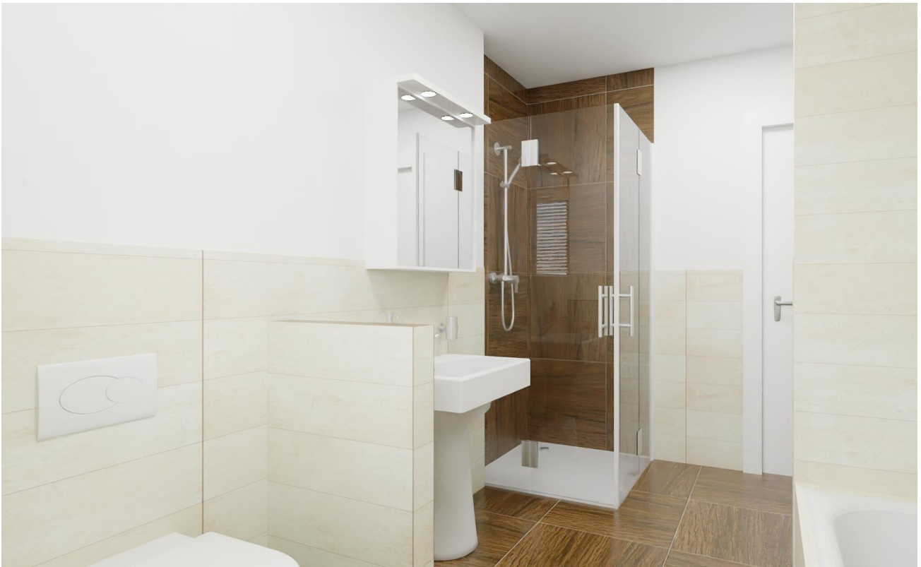
Hauptbad Ansicht 2