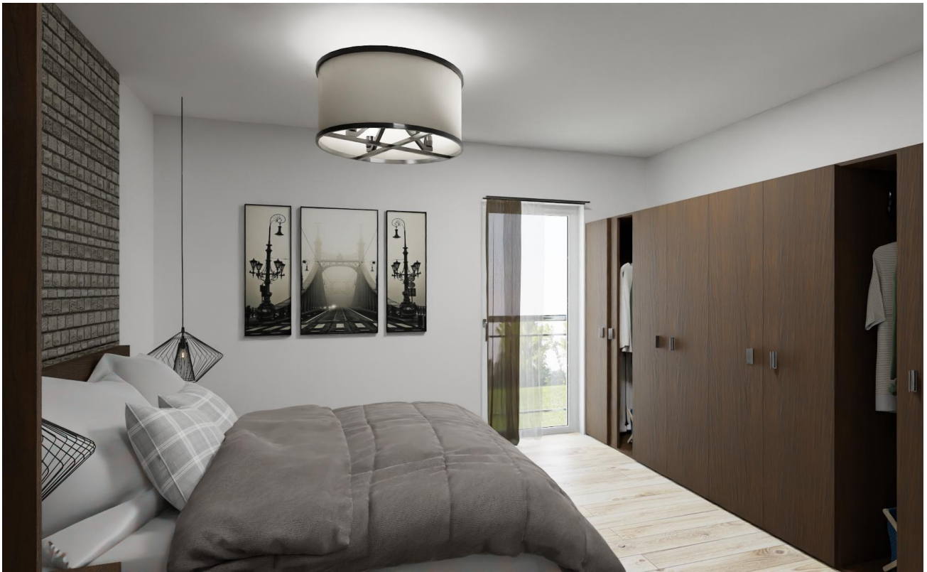
Schlafzimmer Ansicht 1