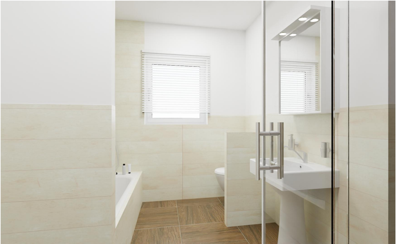
Hauptbad Ansicht 1