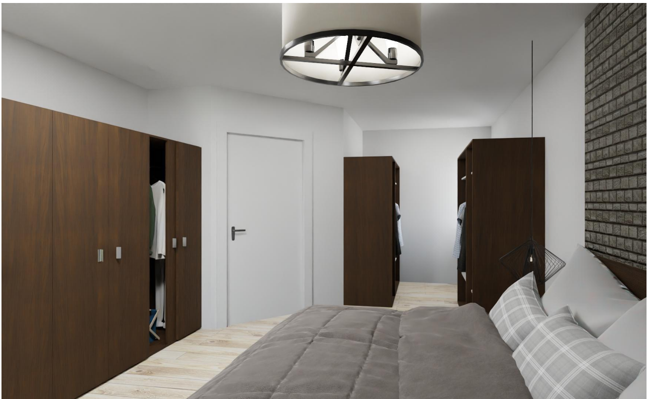
Schlafzimmer Ansicht 2