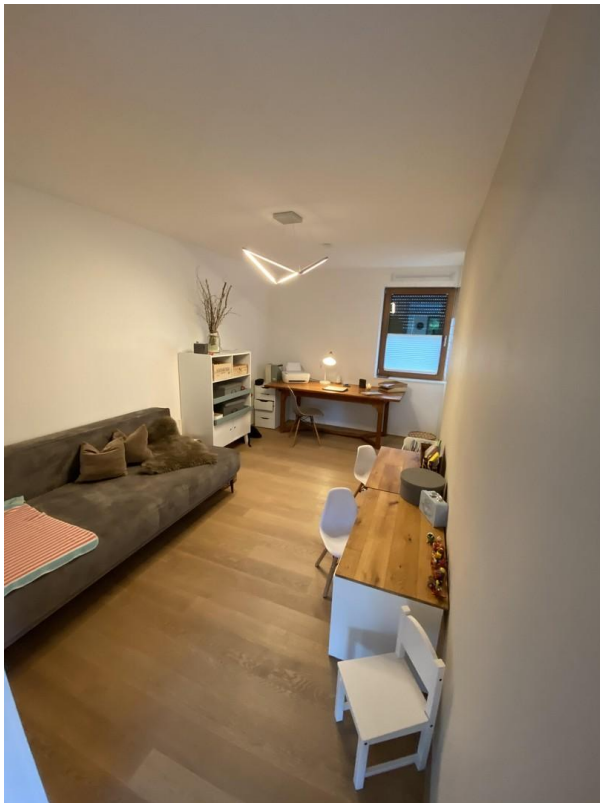
Büro oder Kinderzimmer