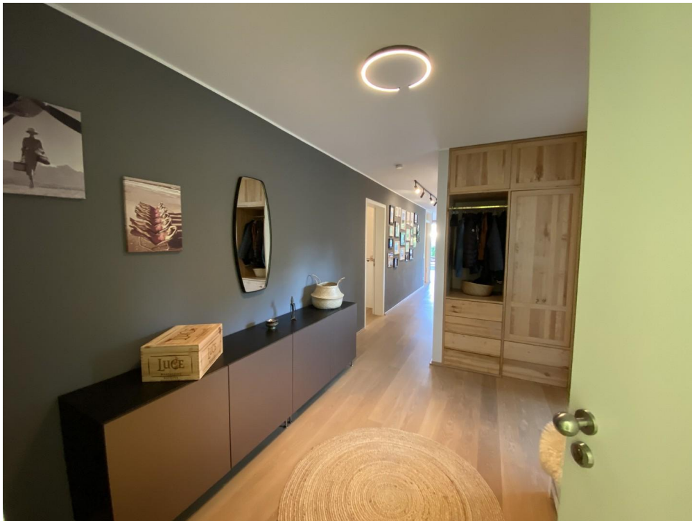
Blick vom Eingang i.d. Flur