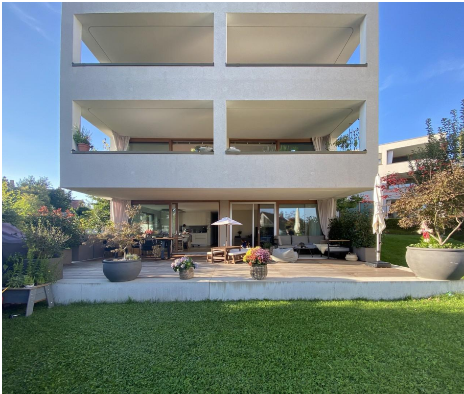
Blick auf das Haus