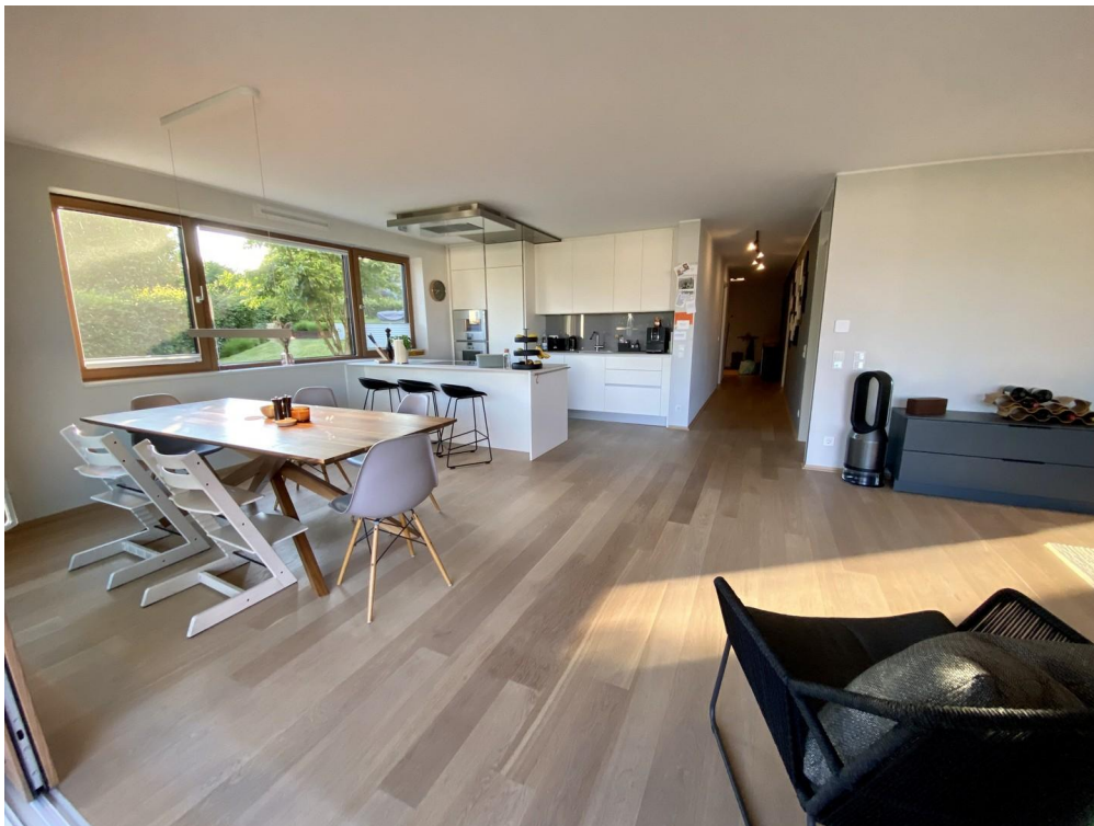
Blick Essbereich und Küche