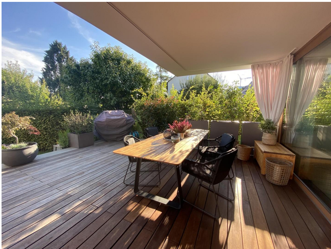
Blick zur Abendsonnenseite