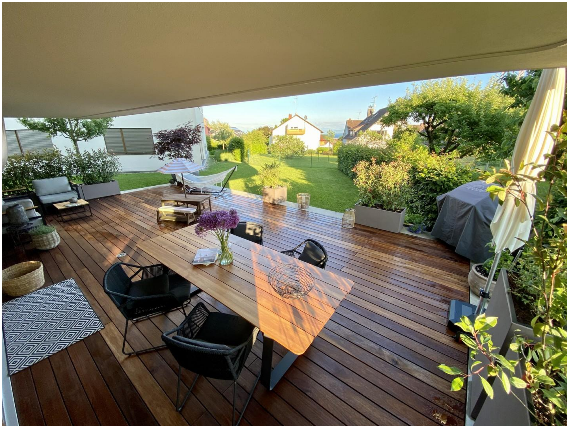
Wunderschöne Terrasse mit 60m2