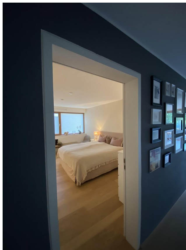
Blick in Schlafzimmer