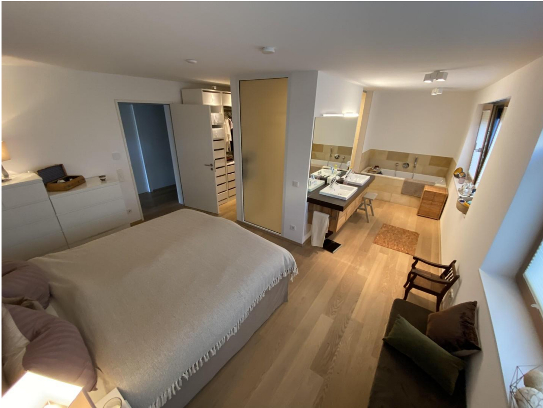
Schlafzimmer, Bad, Ankleide