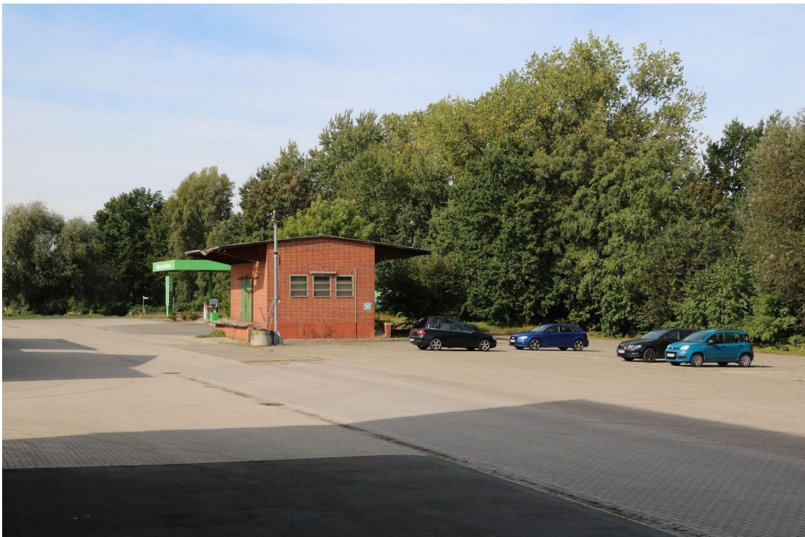
Blick auf die Ausfahrt