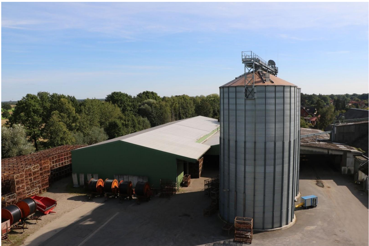
Silolanlage und Lagerhalle