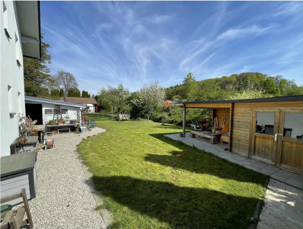
Garten mit Laube u. Gartenhaus