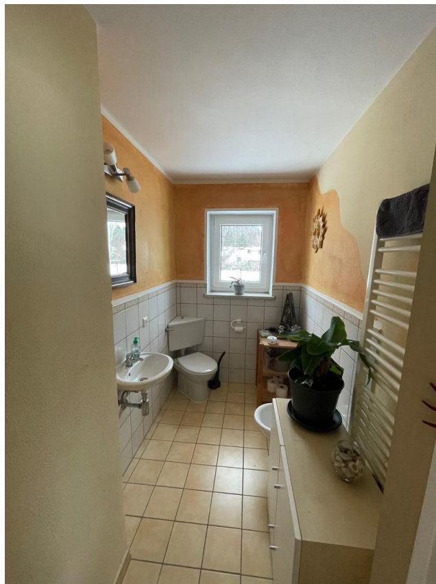
Toilette 1. OG