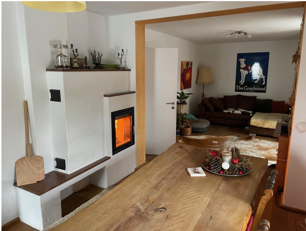
Grundofen im Wohn-Essbereich