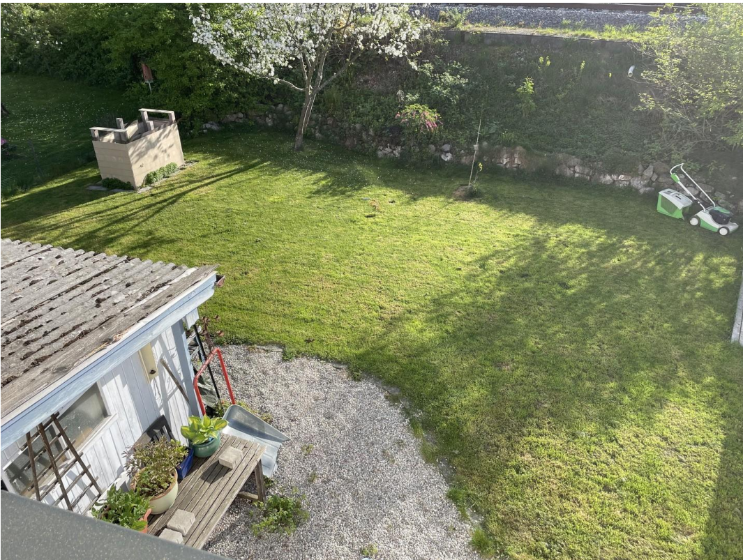
Blick in den Garten