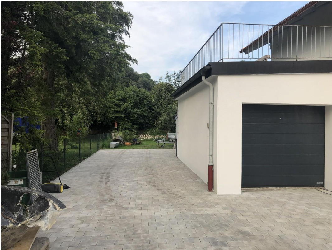
Vorplatz mit Garage