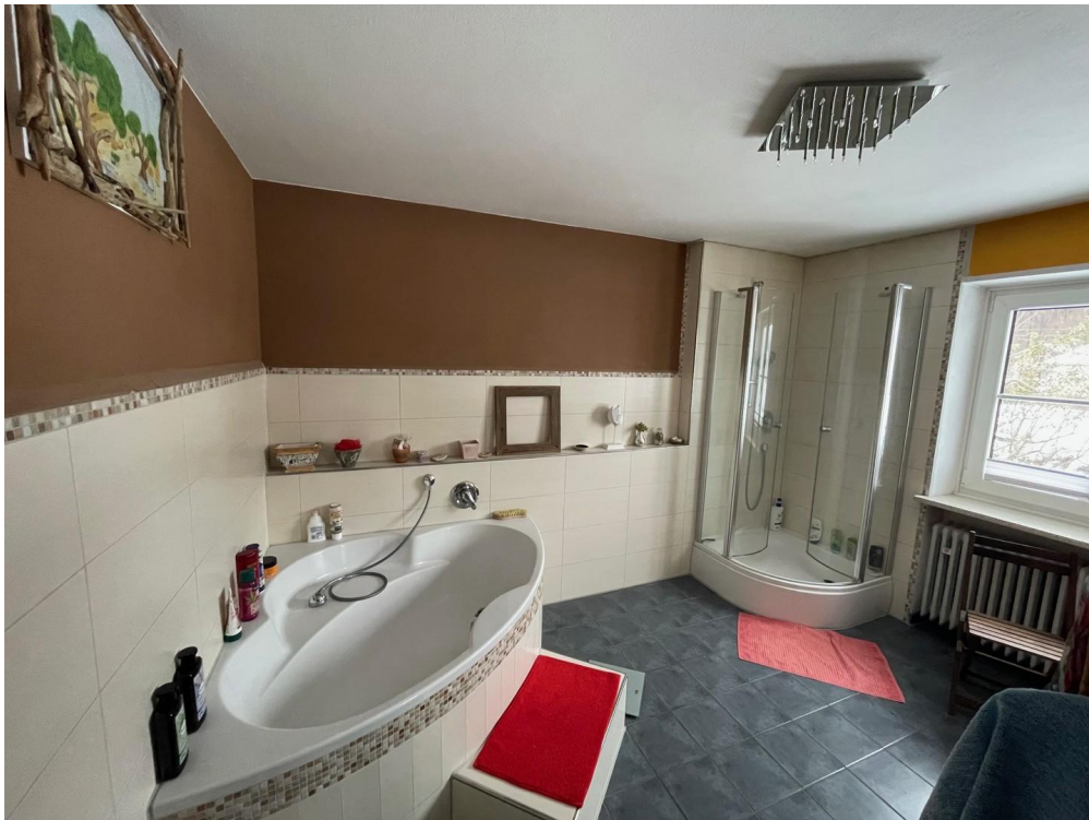
Bad mit Dusche u. Eckbadewanne