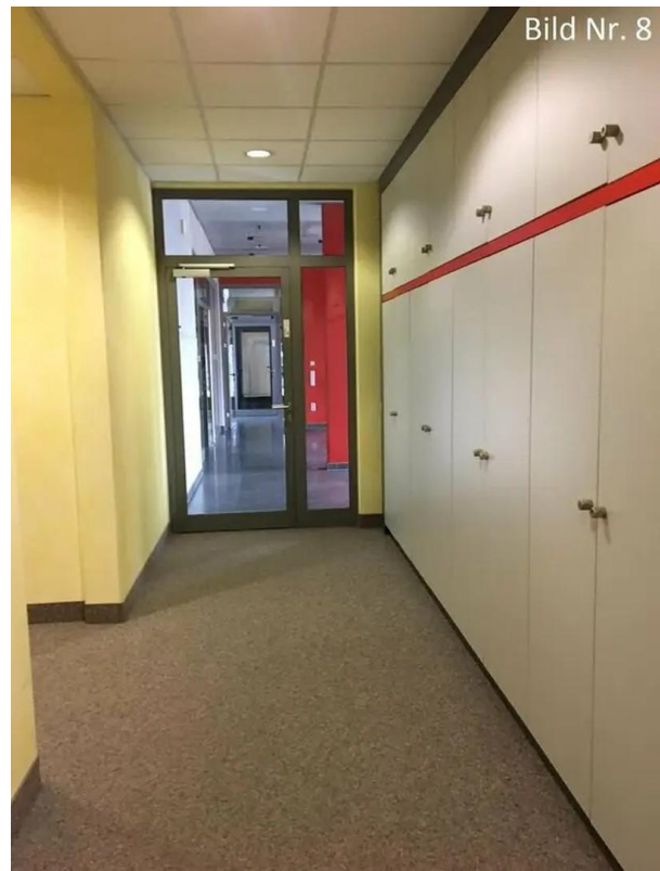
Flur mit Einbauschränken