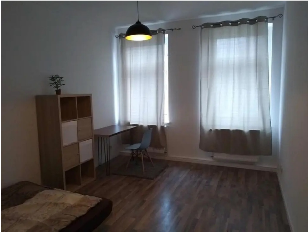
Wohnzimmer / Arbeitszimmer