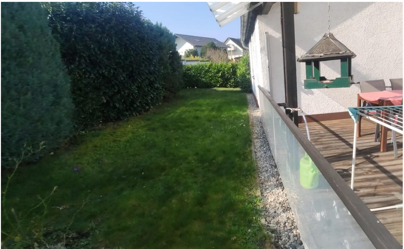
Terrasse 2 im EG