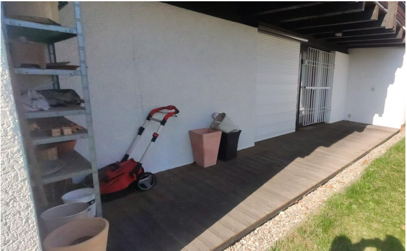
Terrasse 1 im EG