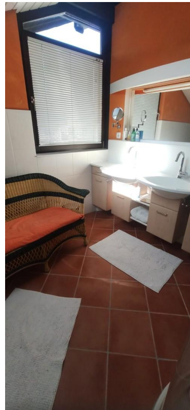
Bad m. Doppelwaschbecken DG