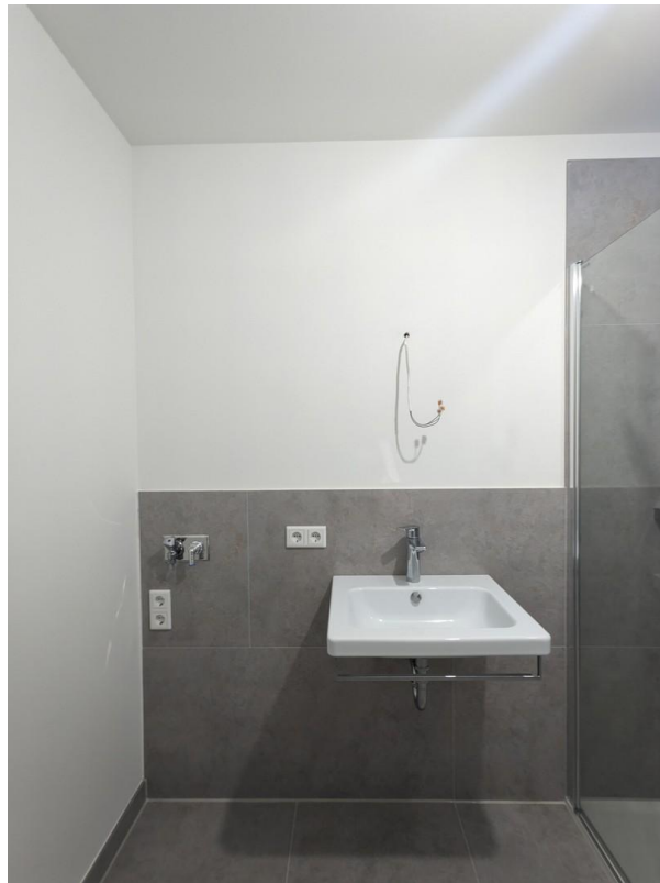
Badezimmer (Spiegel vorhanden)