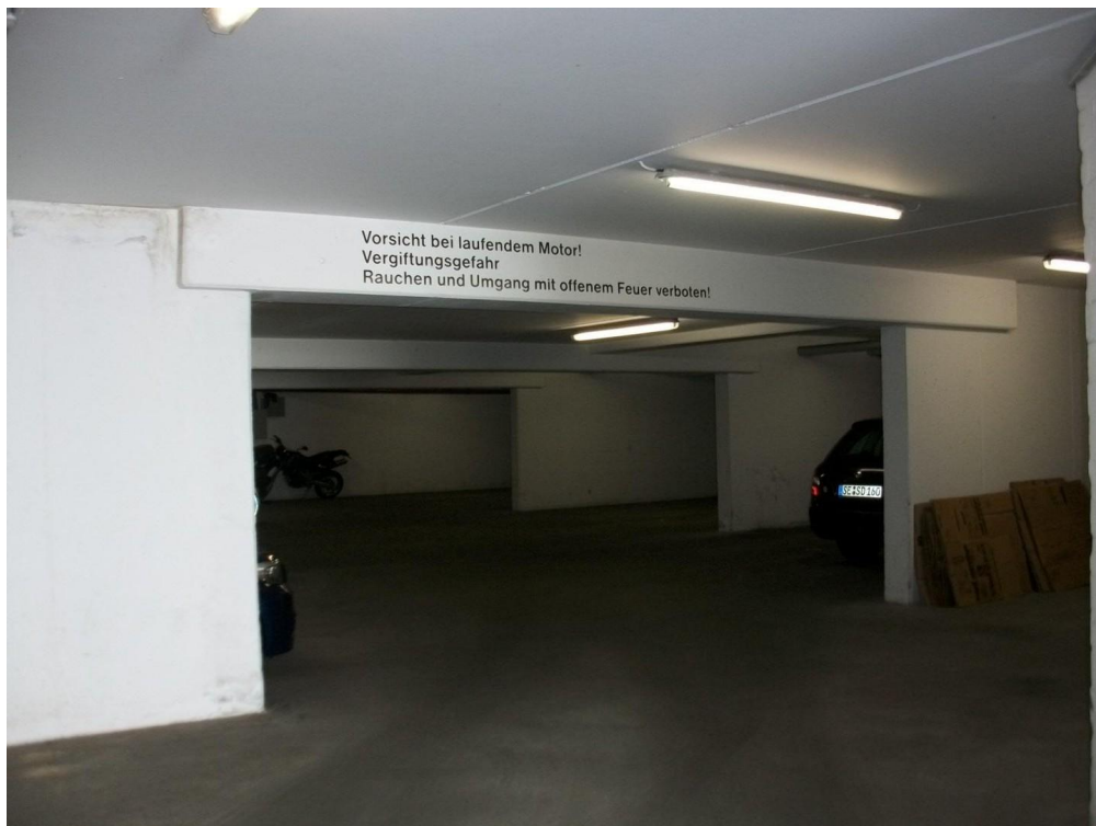
Tiefgarage im Haus