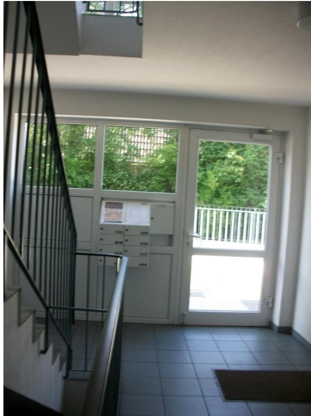
Hauseingang mit Treppenhaus