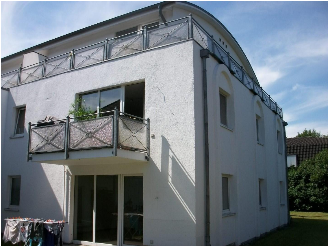
Lage der Wohnung zu Gärten