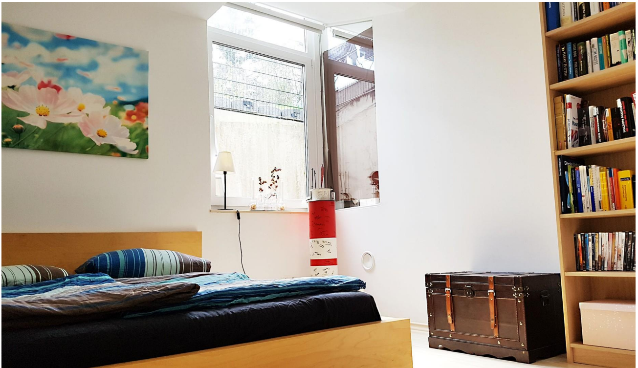
Untergeschoss = 2,90m Fenster