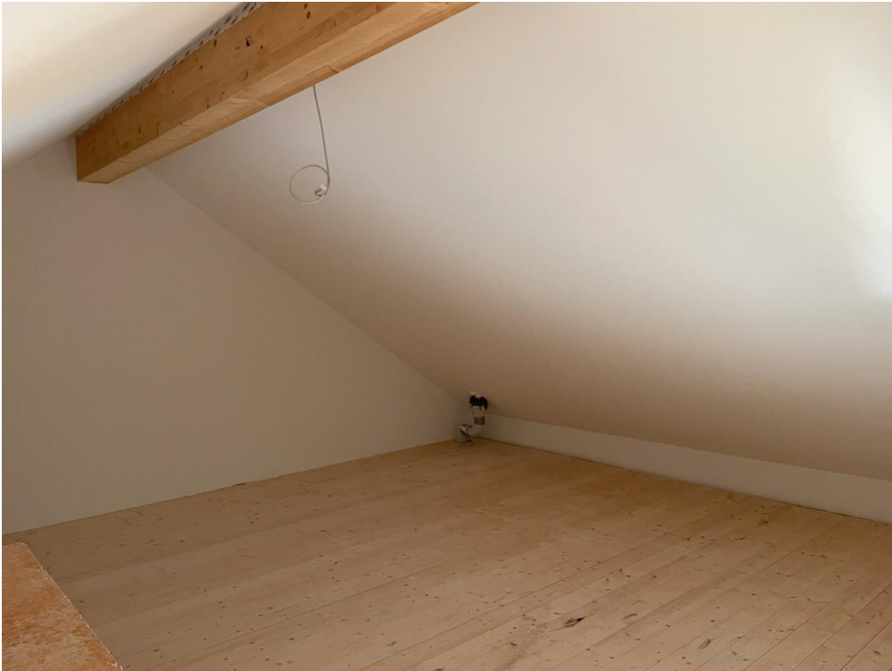
Stauraum im Dachgeschoss