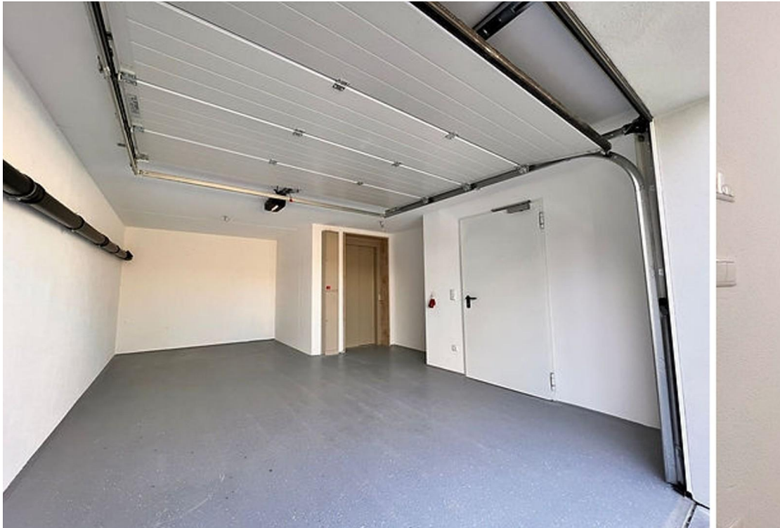
Garage mit Aufzug