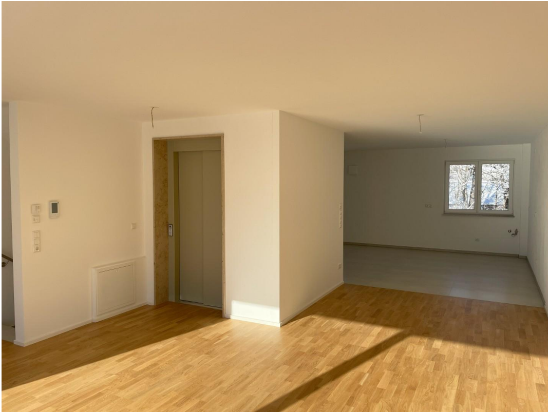
Blick in Küche aus Wohnbereich