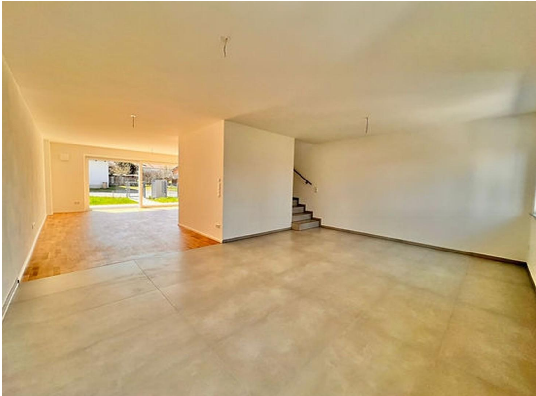
Blick Küche in Wohnbereich