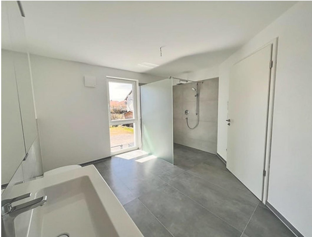
oberes Badezimmer -2