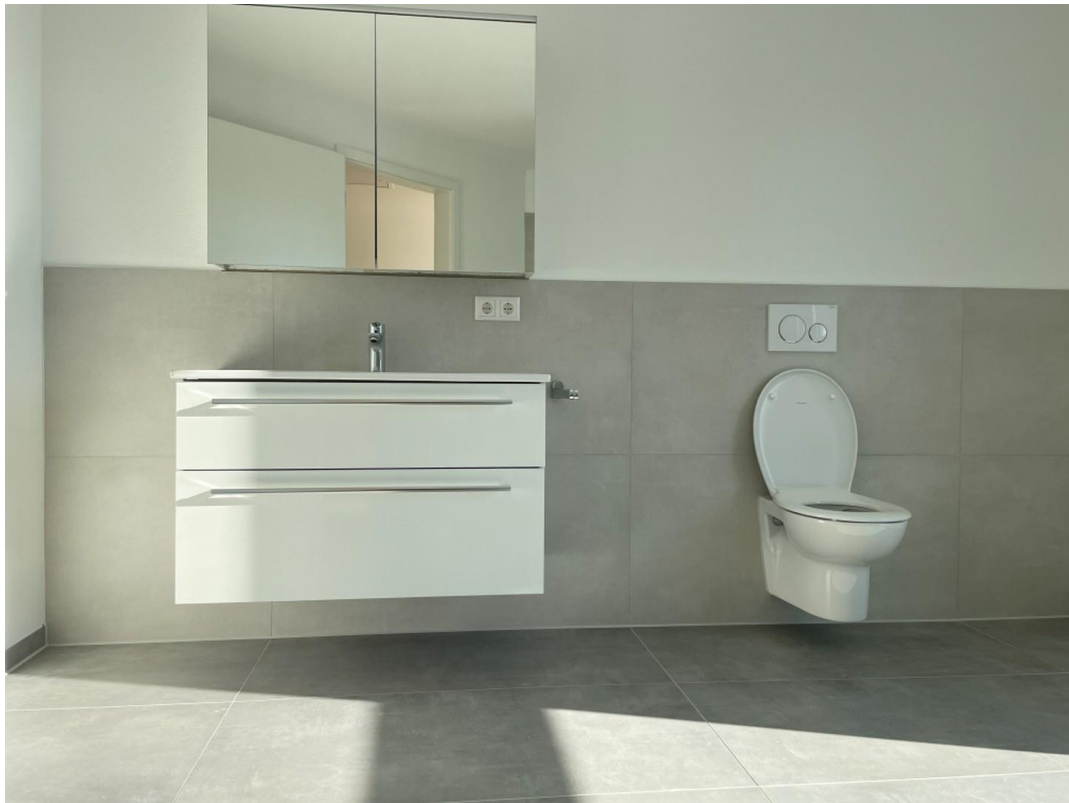
oberes Badezimmer -1