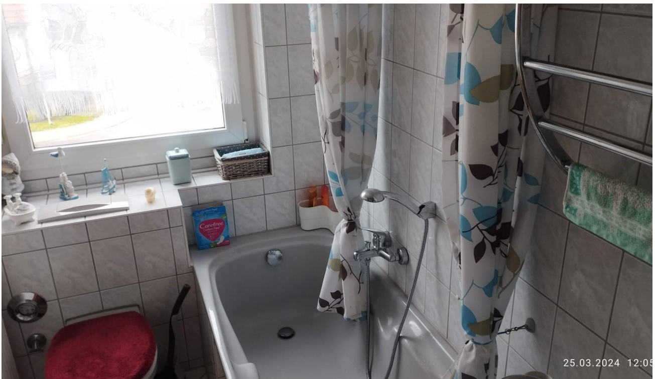
Bad mit Fenster