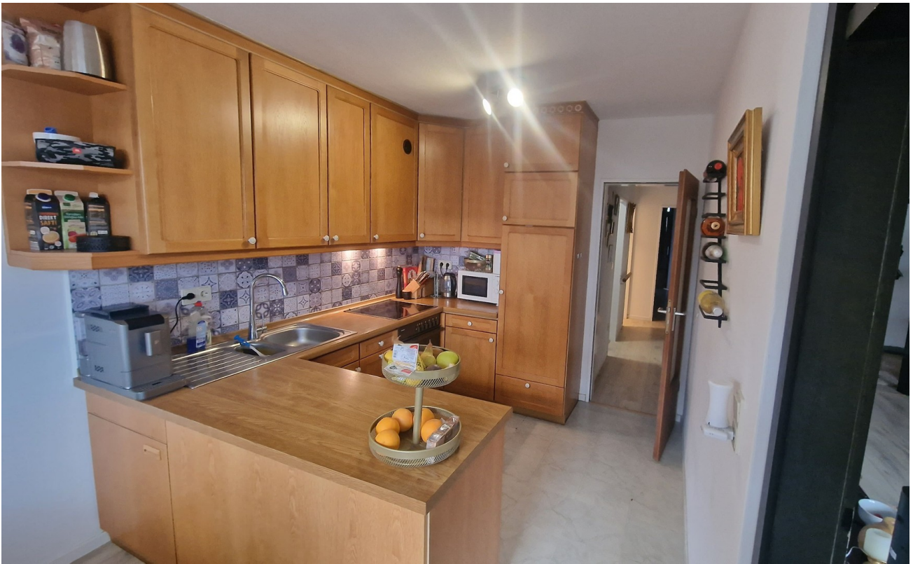
Küche / Esszimmer