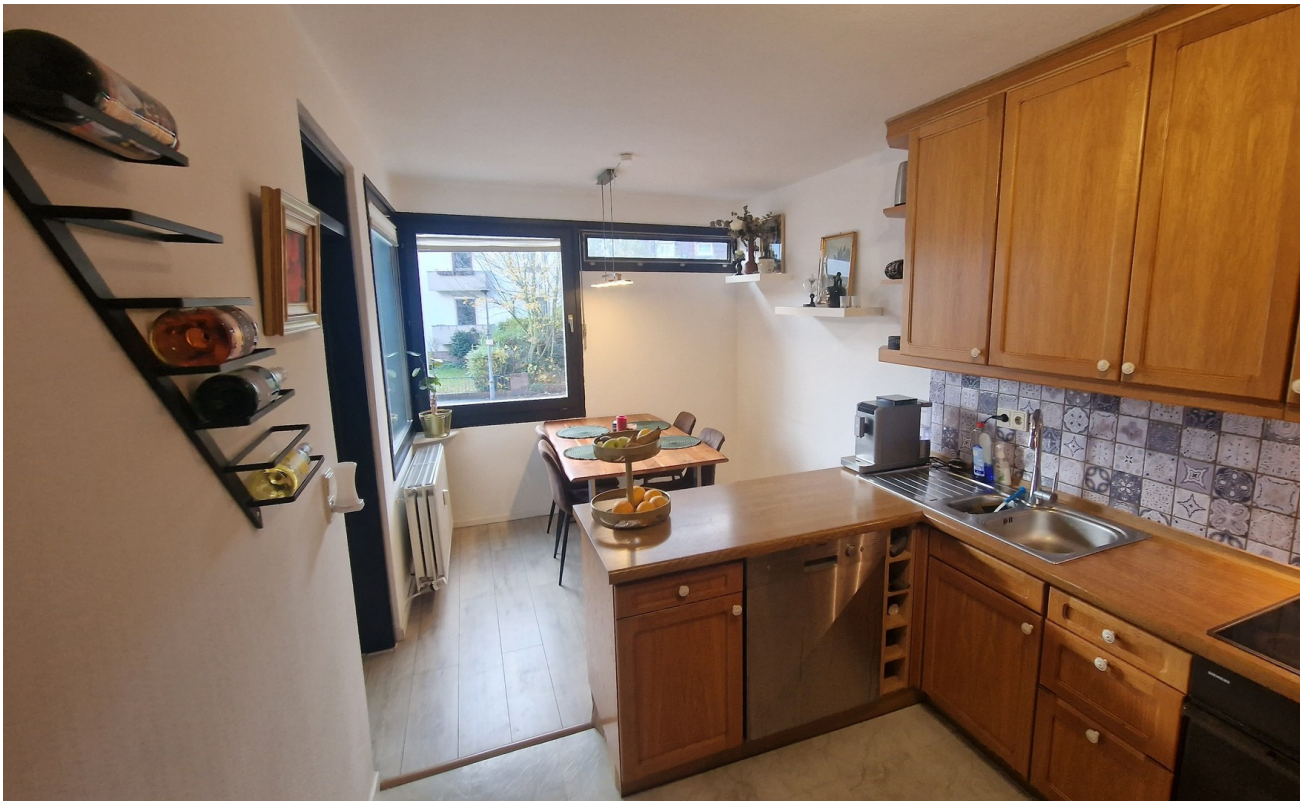
Küche / Esszimmer