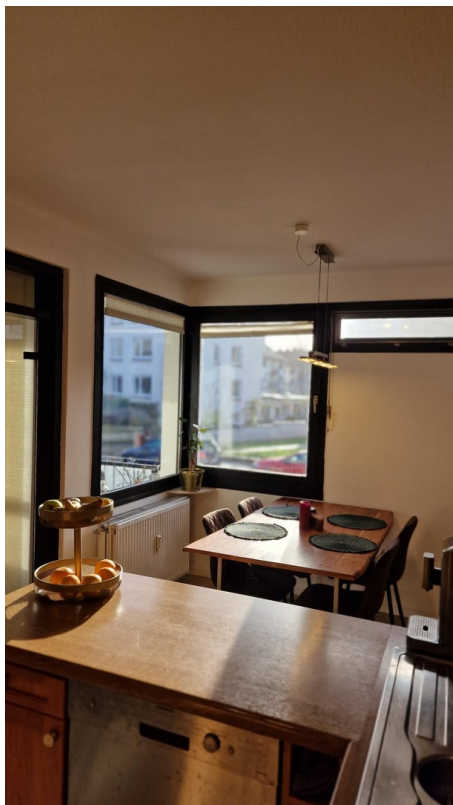
Küche / Esszimmer