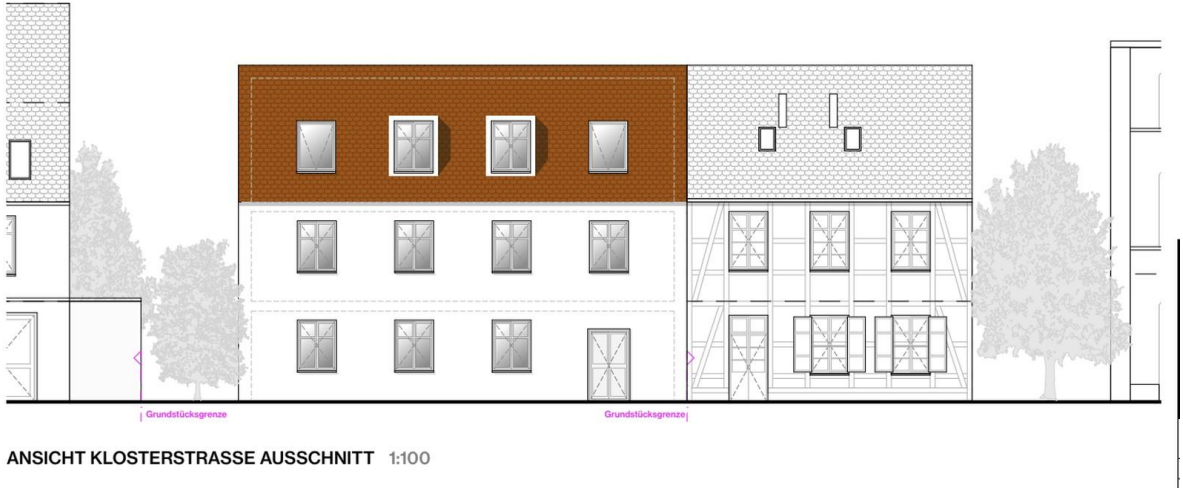
ANSICHT KLOSTERSTRASSE AUSSCHNITT 1:100