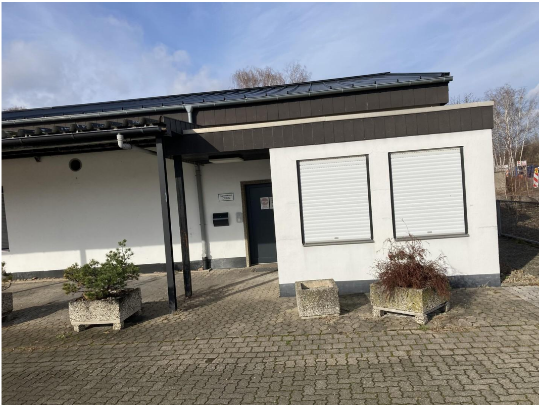
Ansicht Haupteingang und Büro