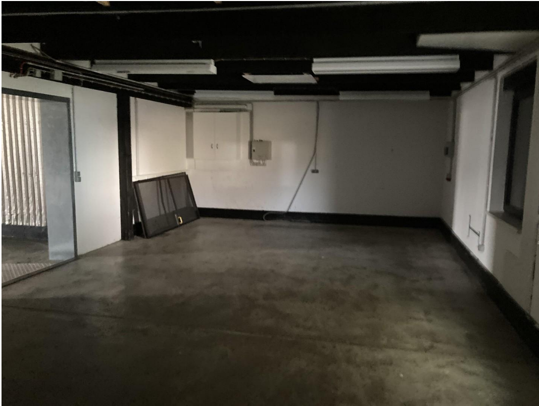
Nebenraum 2 / Versand