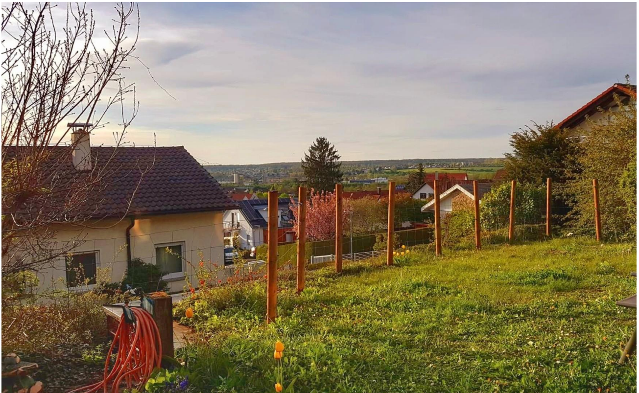
Aussicht der Gartenebene