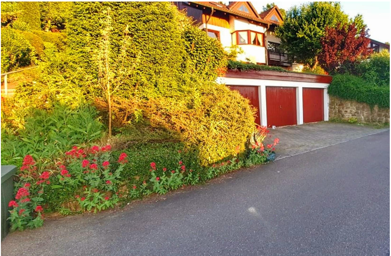
Ansicht bei Anfahrt