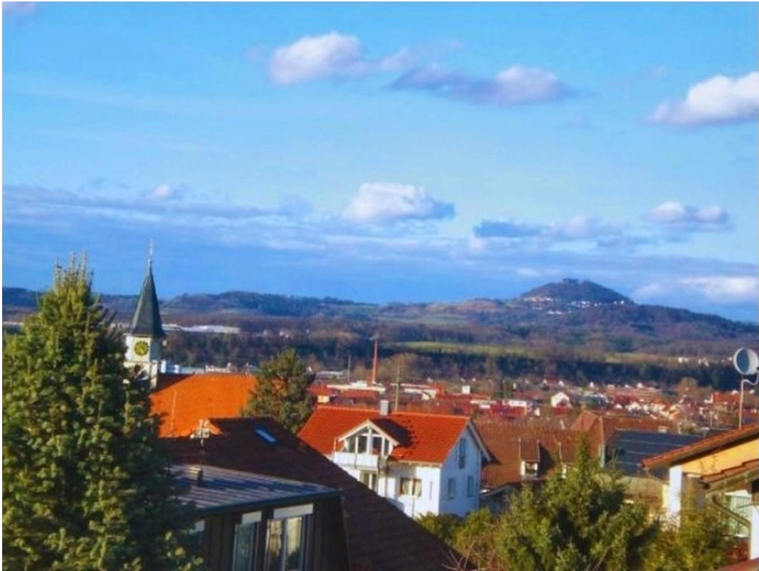
Ausblick von einem der Balkons