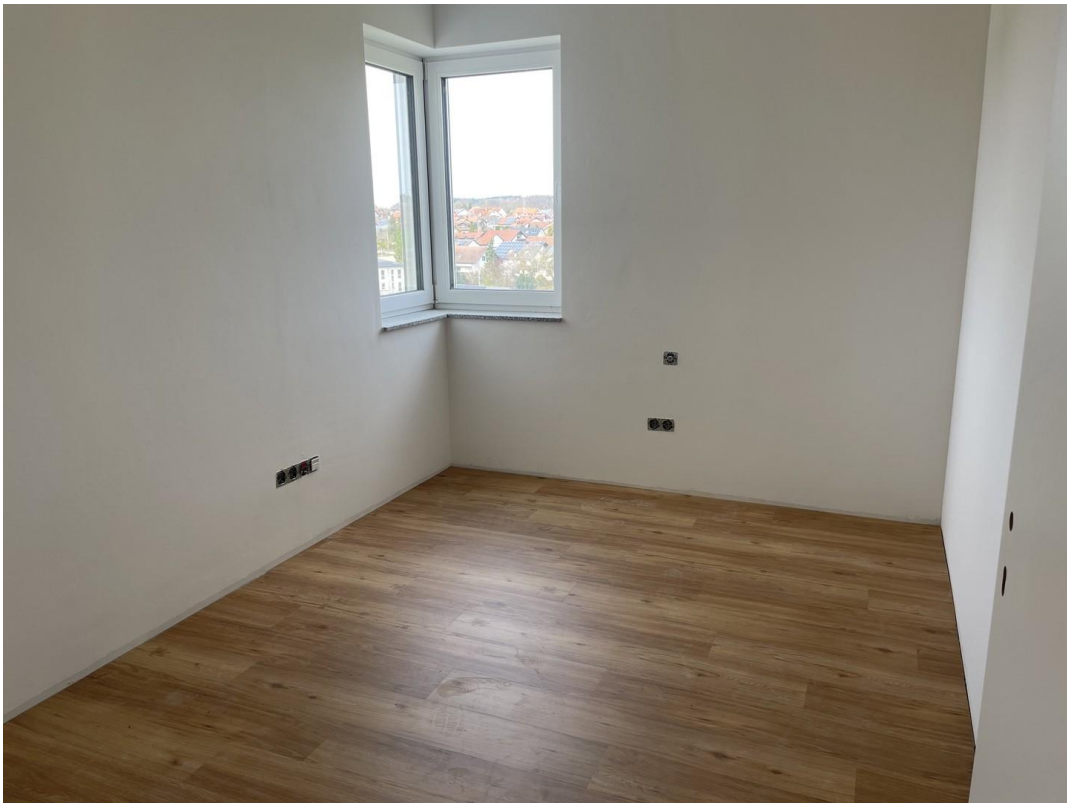
Arbeitszimmer mit Eckfenster