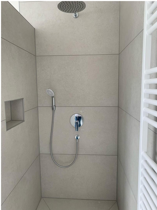
Dusche mit Rainshower