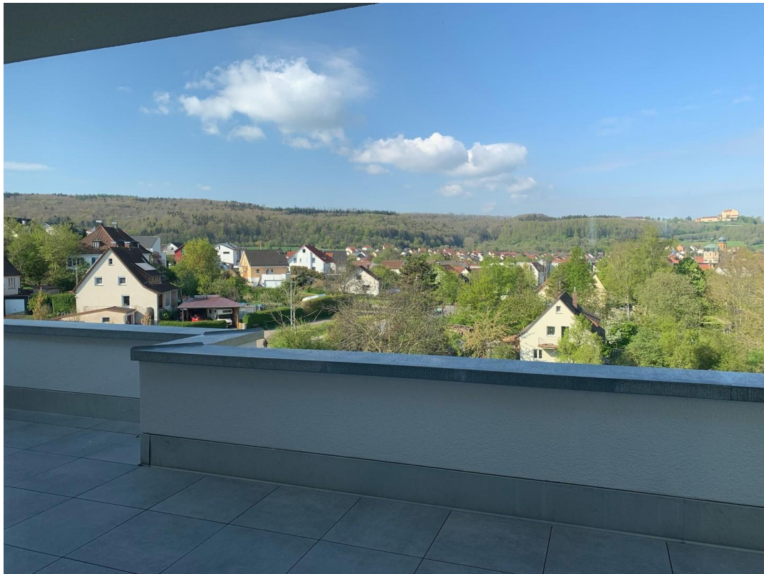
Ausblick von der Dachterrasse