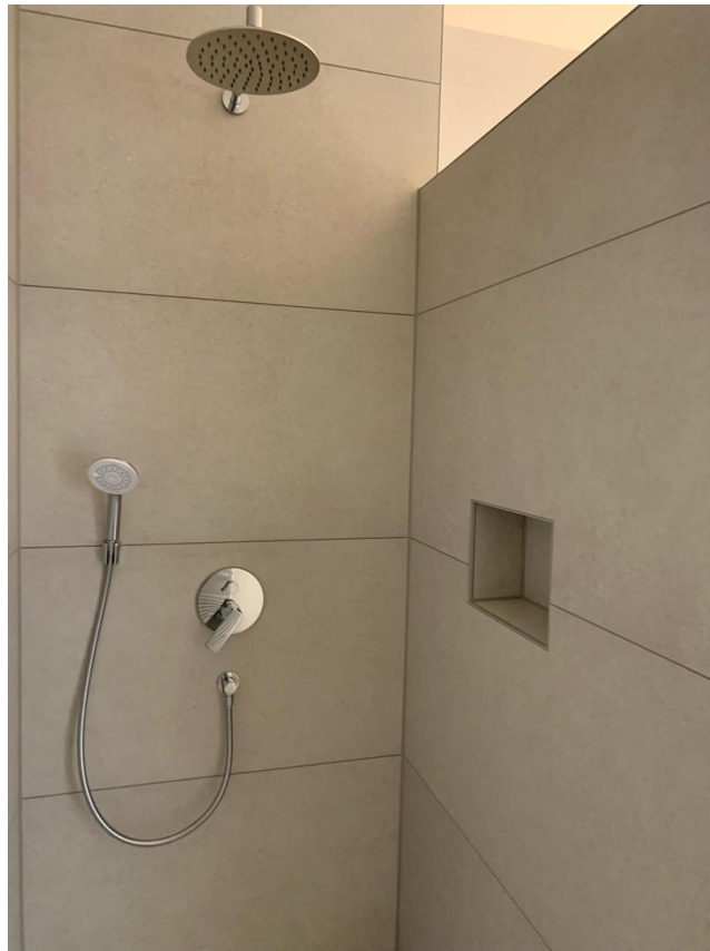
Dusche mit Rain-Shower