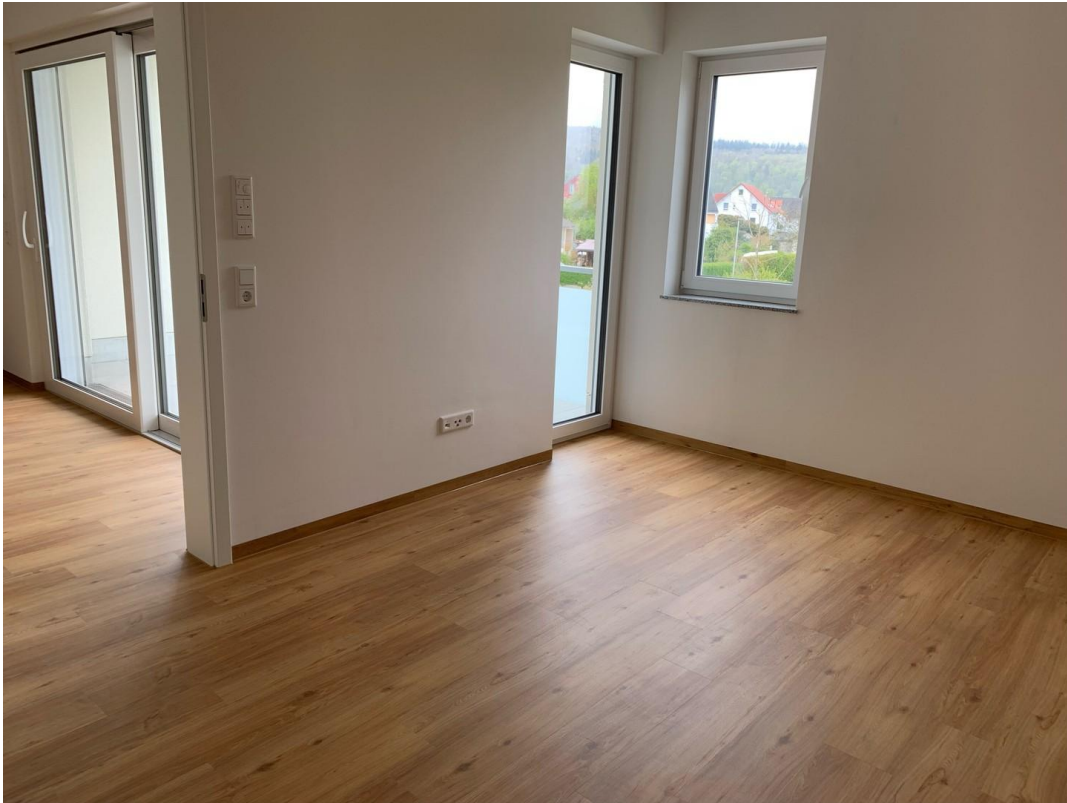
Schlafzimmer mit Balkon-Zugang