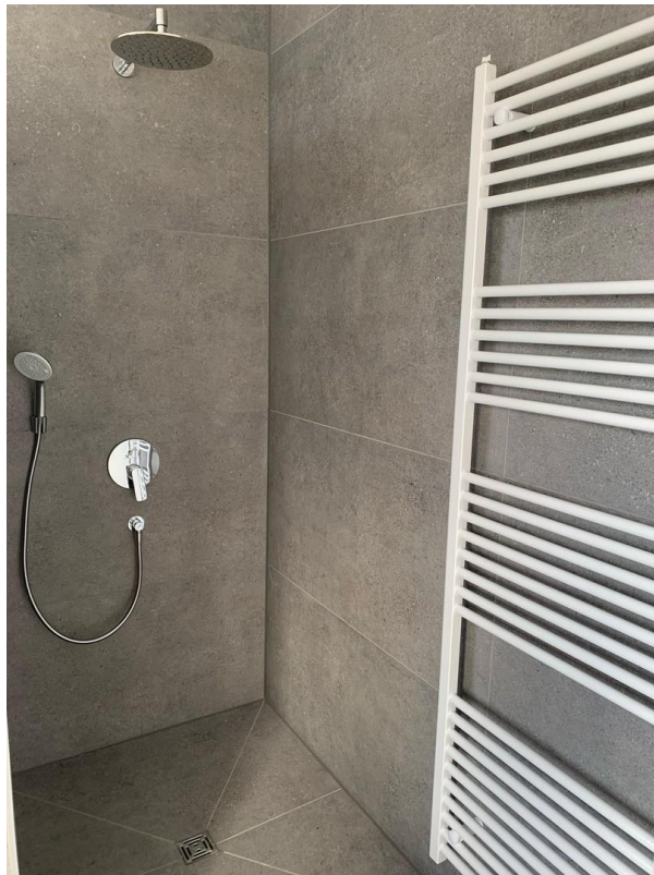
Bad mit Rain-Shower