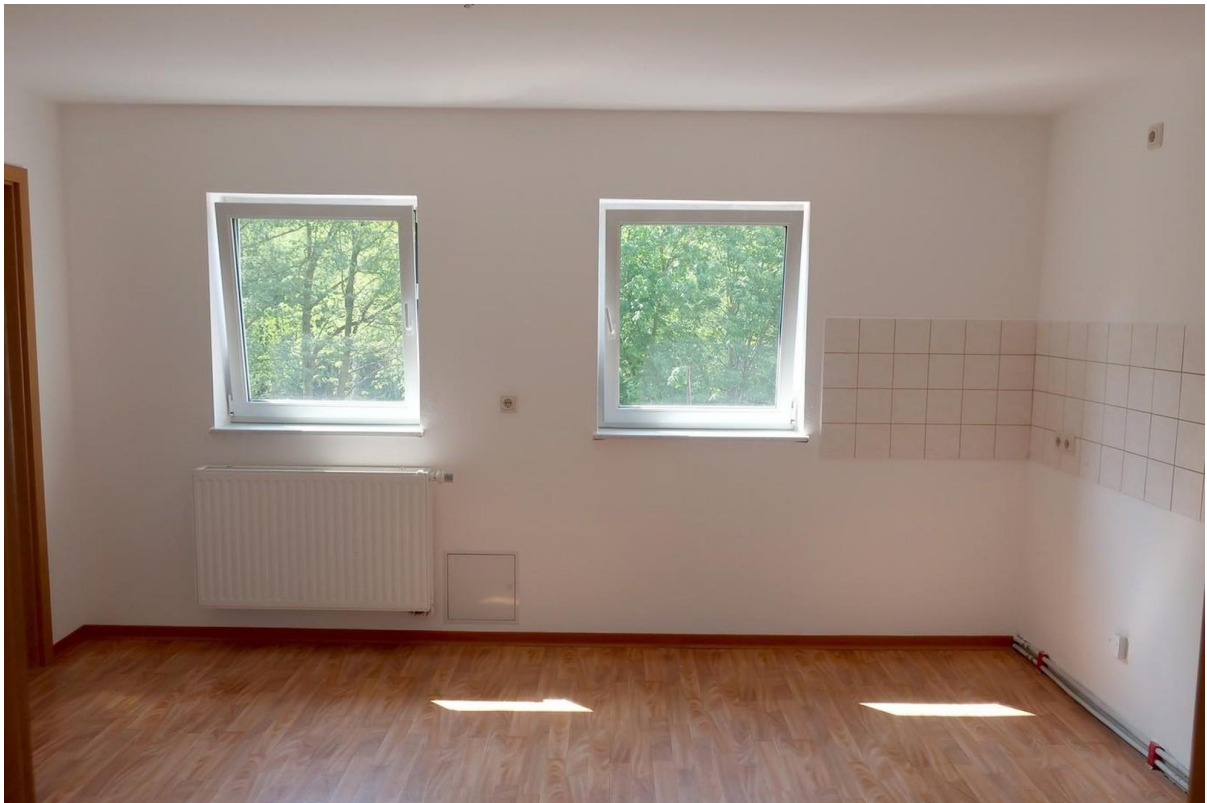
Küche (EBK vorhanden)