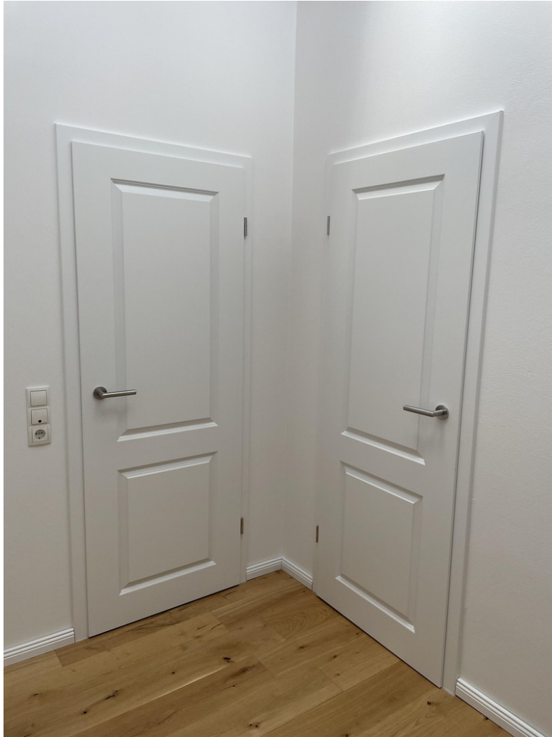
Neue Türen und Parkettboden