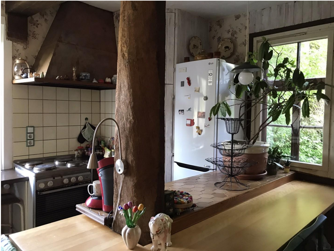
Küche EG - Frühstückstheke