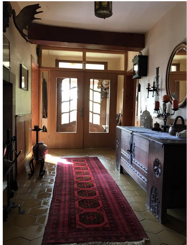
Flur EG Richtung Haupteingang