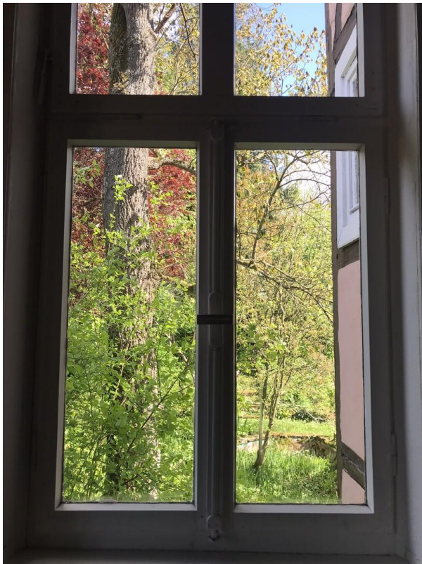
Gartensicht vom Bad 1. OG