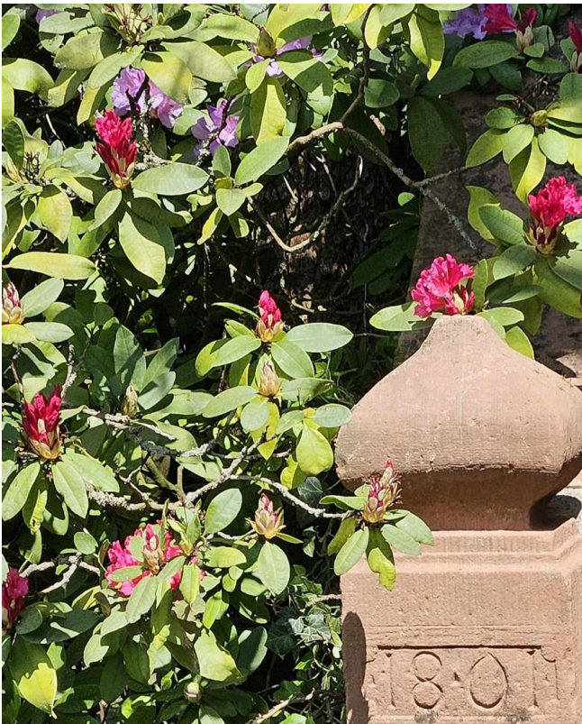
1801 - Sandsteintreppe