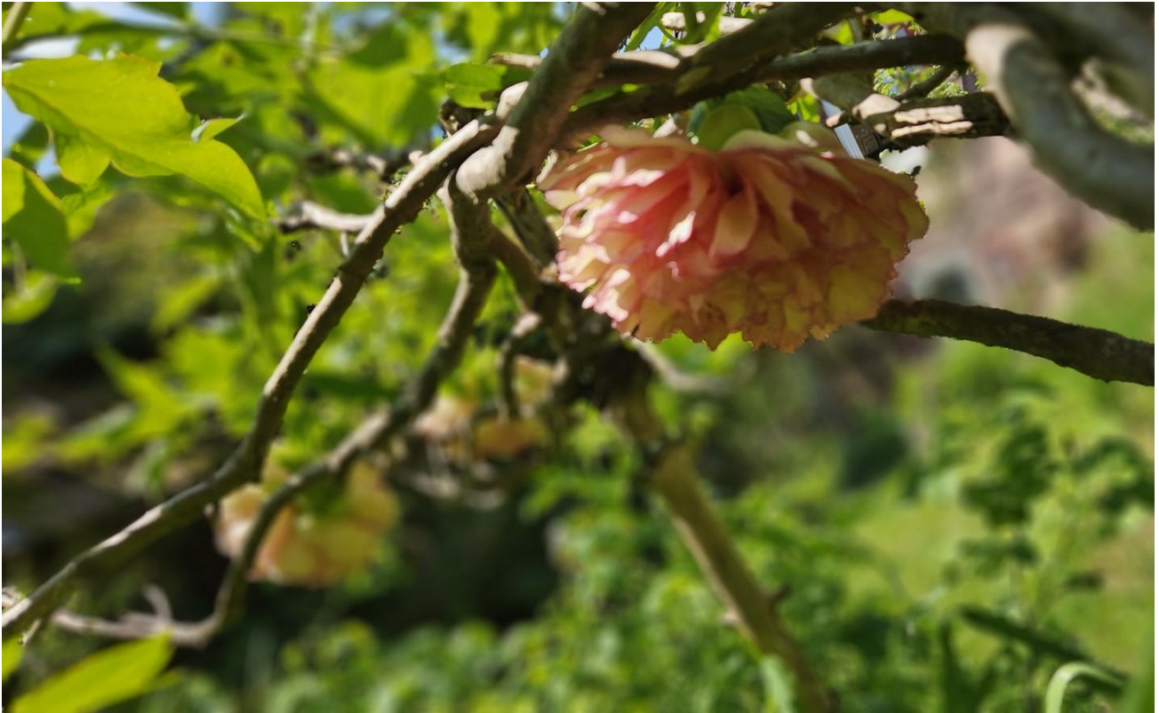
Besondere blühende Sträucher