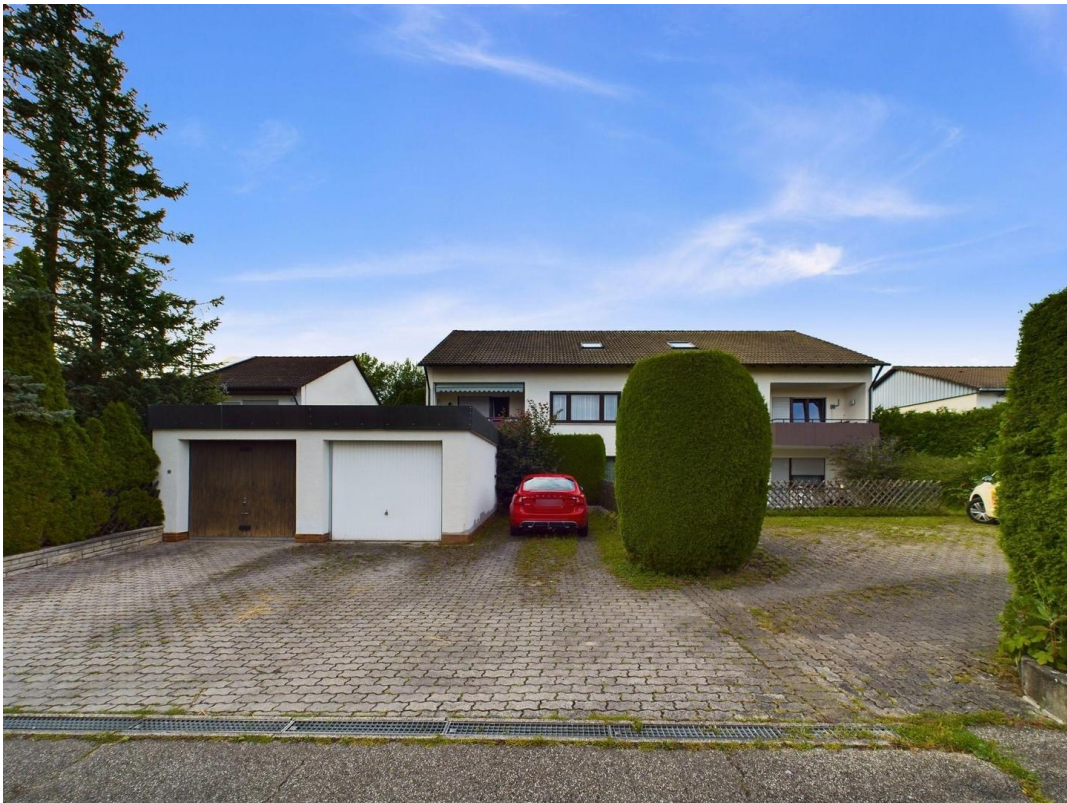
Garage + Stellplatz