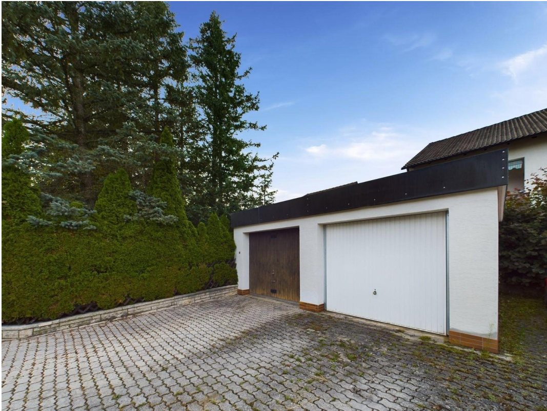
Garage + Stellplatz