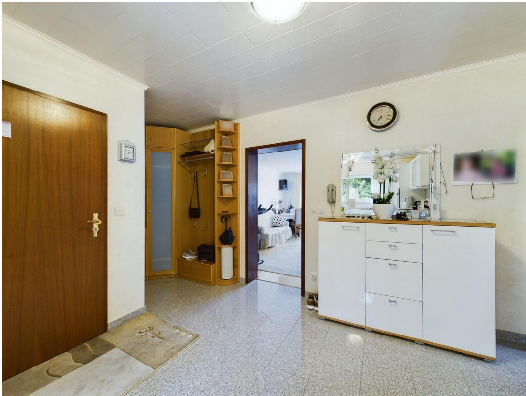
Haupteingang / Flur