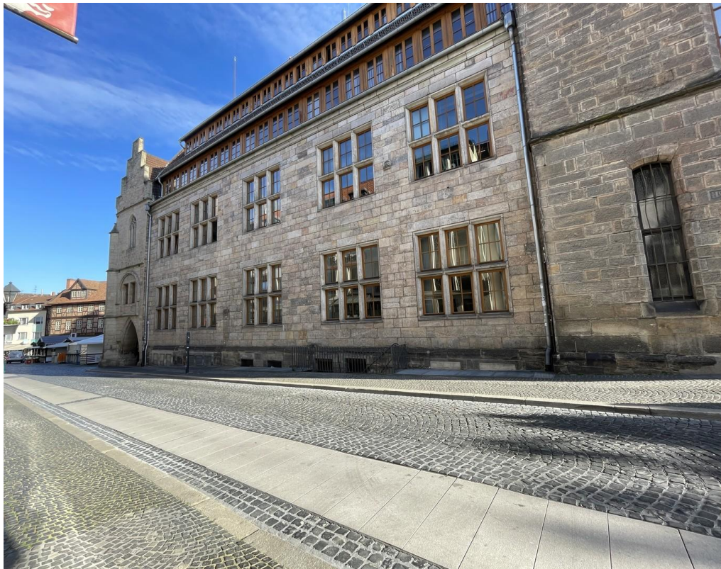
Ausblick vom Hauseingang