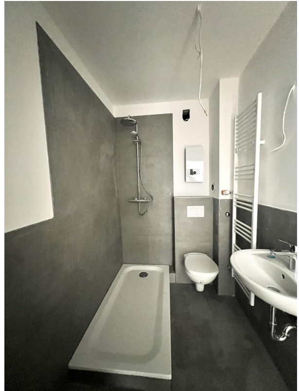
Bad(Glas-Duschwand kommt noch)