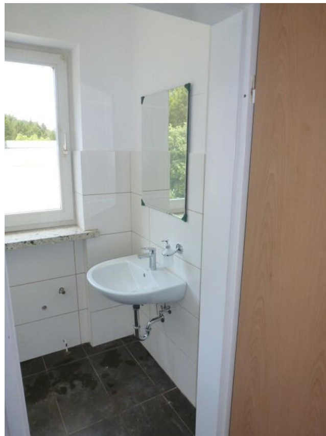
Muster Gäste WC