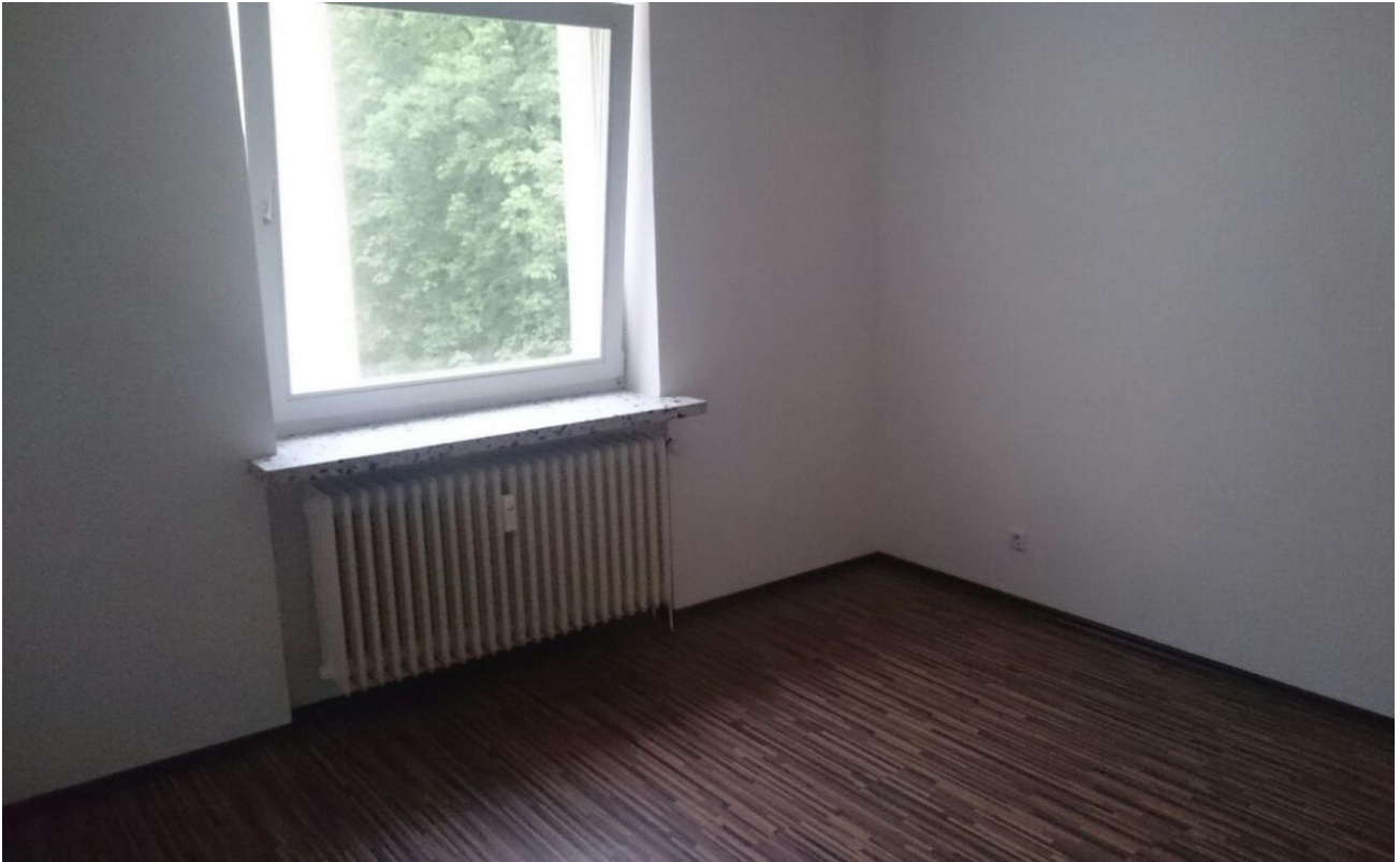
Muster Schlafzimmer 1