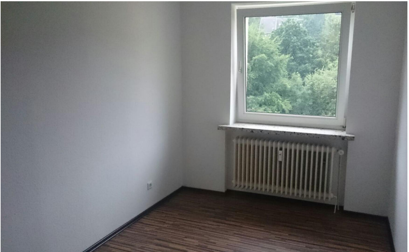
Muster Schlafzimmer 2