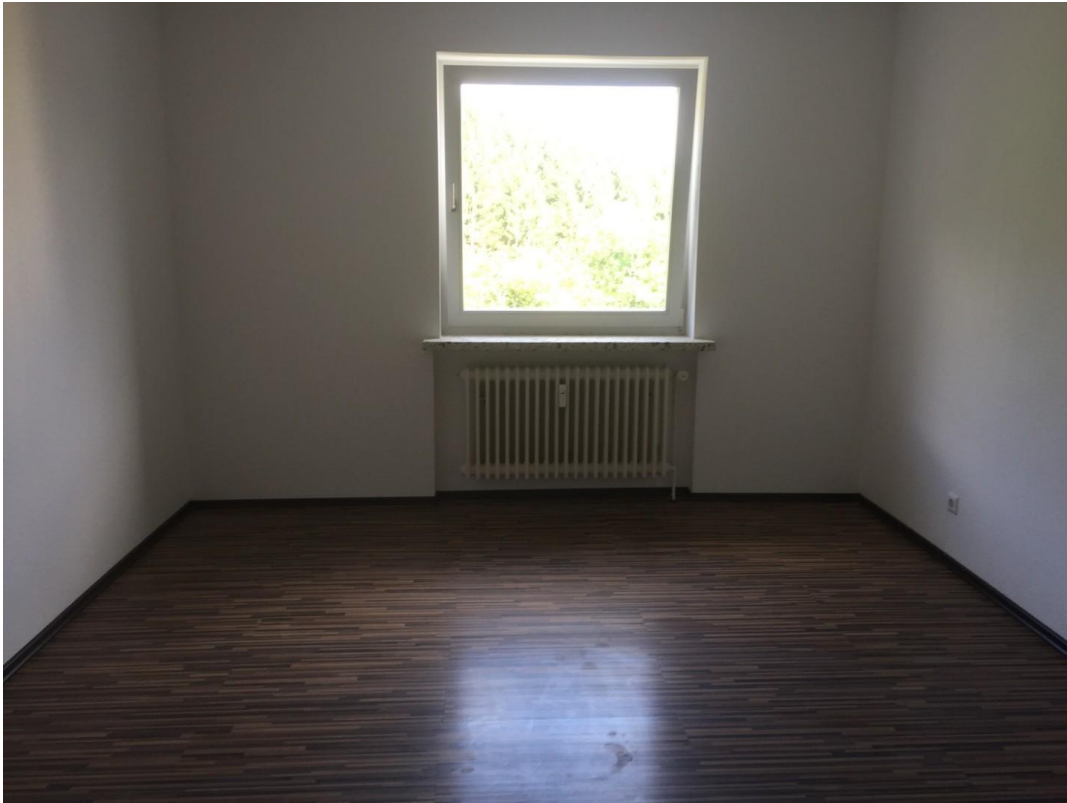
Muster Schlafzimmer 3