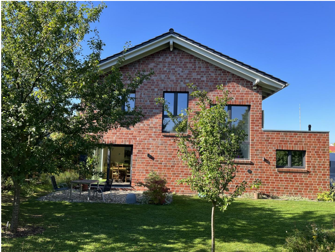
Gartenseite mit Terrasse