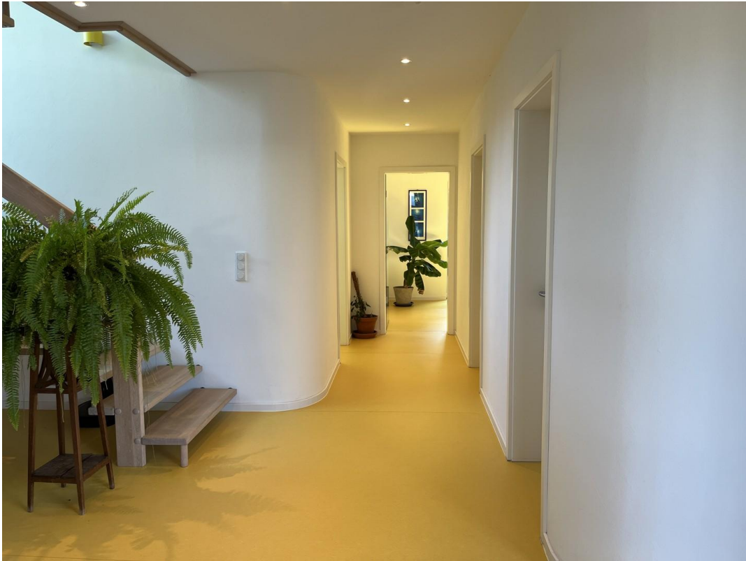
Flur Richtung Süden