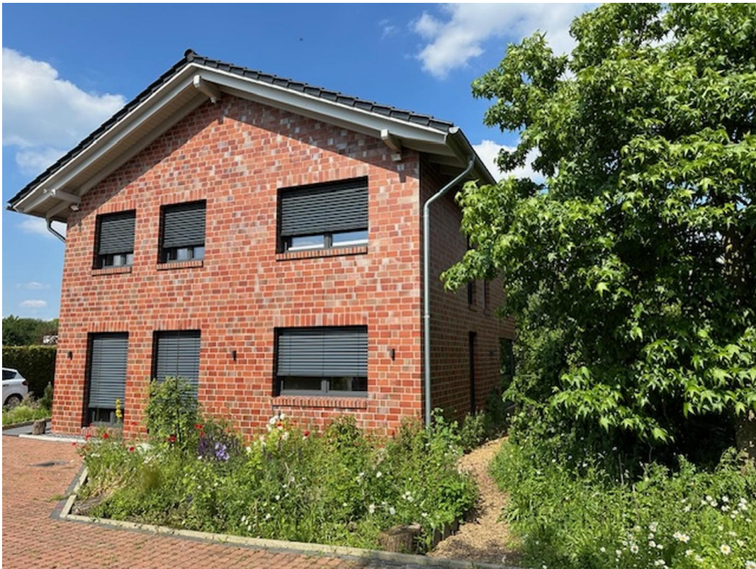
West-Ansicht mit Blumenwiese