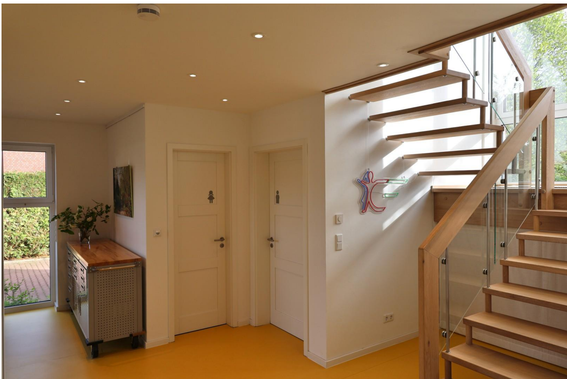
Flur mit Treppenaufgang