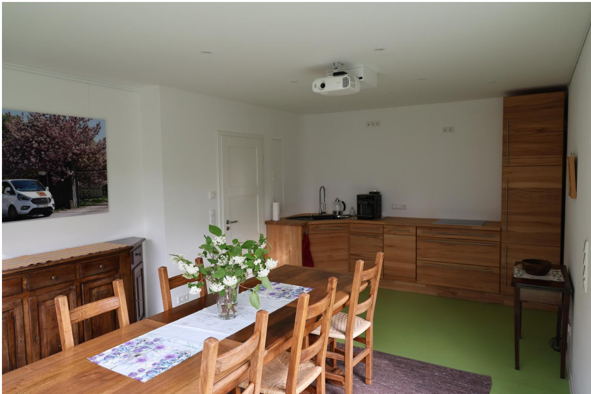
Küche / Besprechung