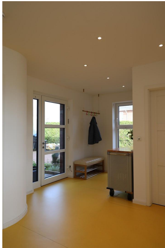
Flur mit Haustür