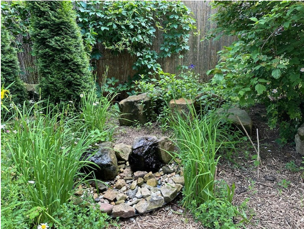
Sprudelstein im Garten