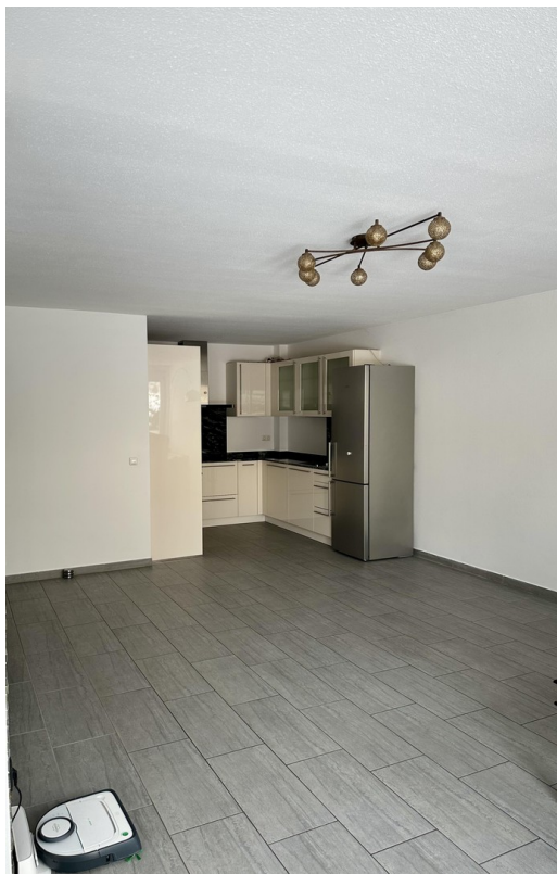
Wohnzimmer in Richtung Küche