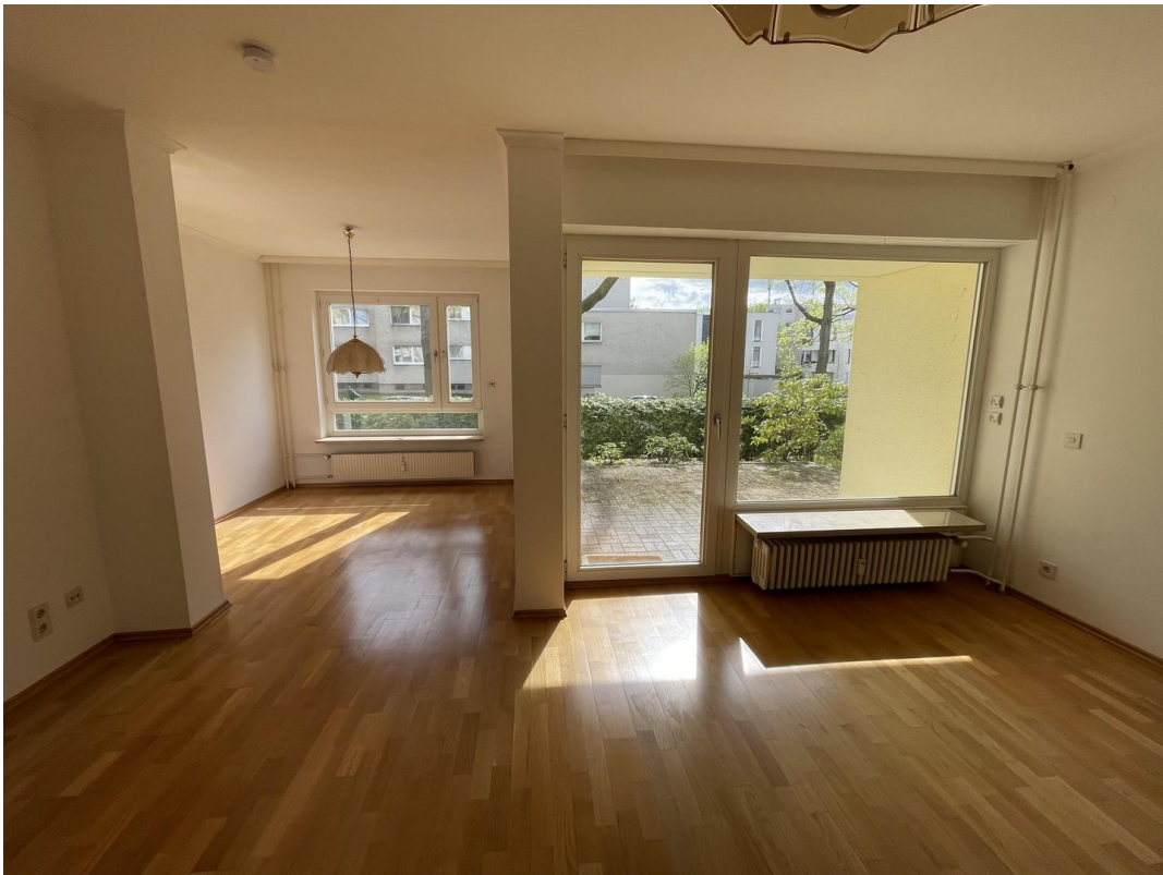
Wohn- / Essbereich