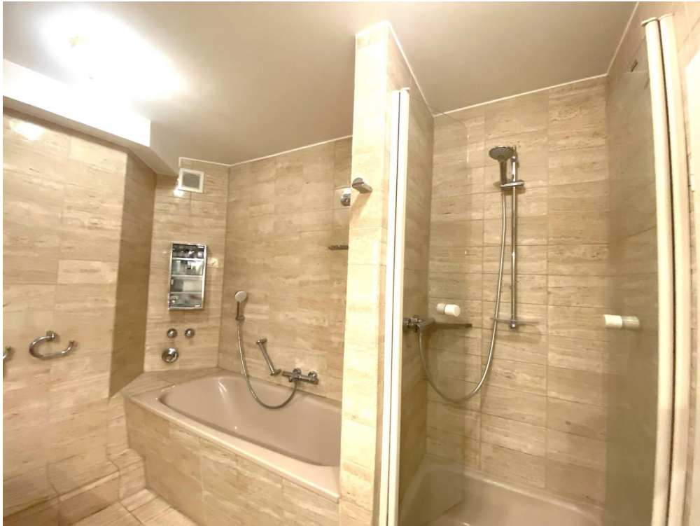
En suite Badezimmer