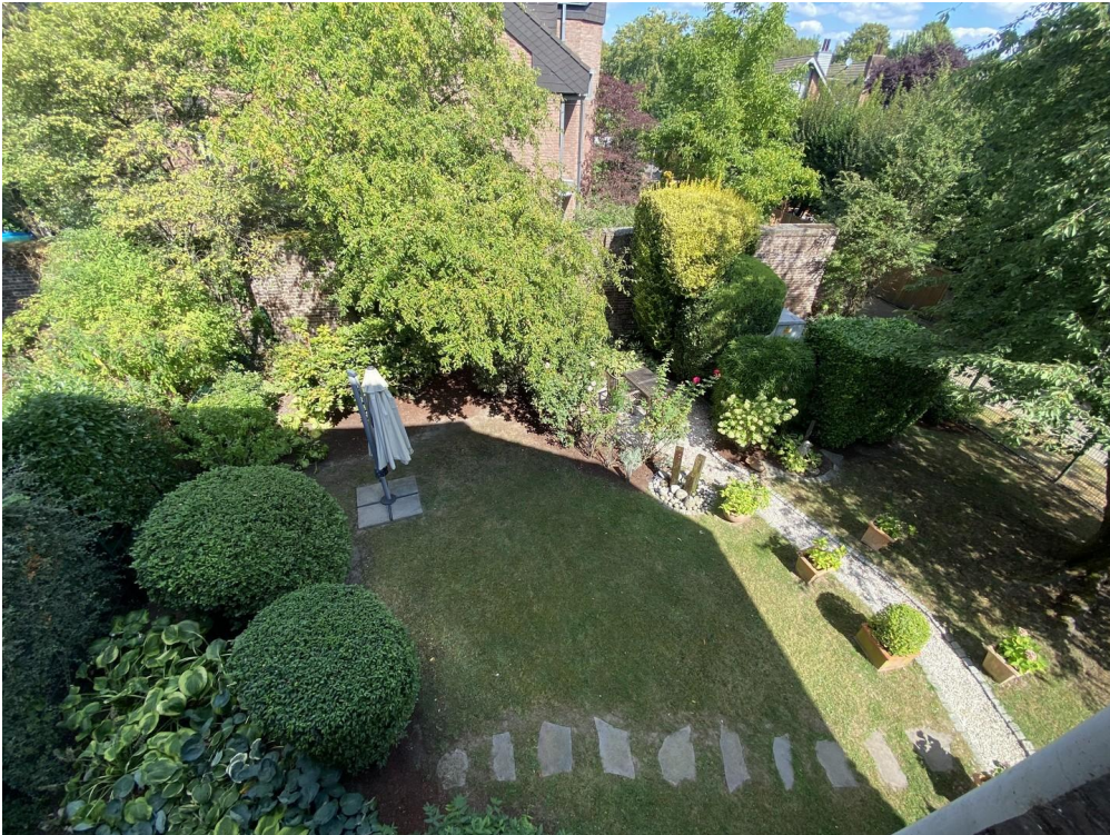
Aussicht in den Garten