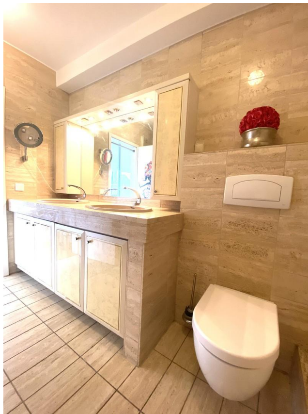
En suite Badezimmer