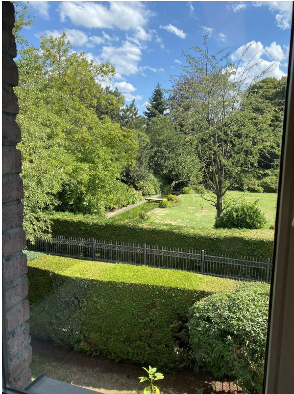
Aussicht aus dem Schlafzimmer