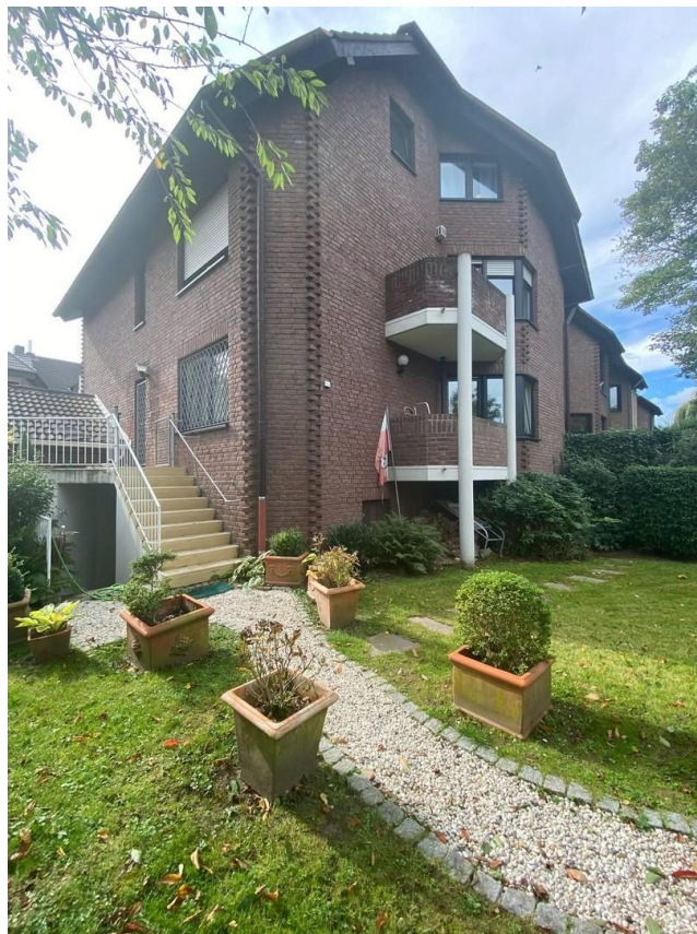
Hausansicht aus dem Garten