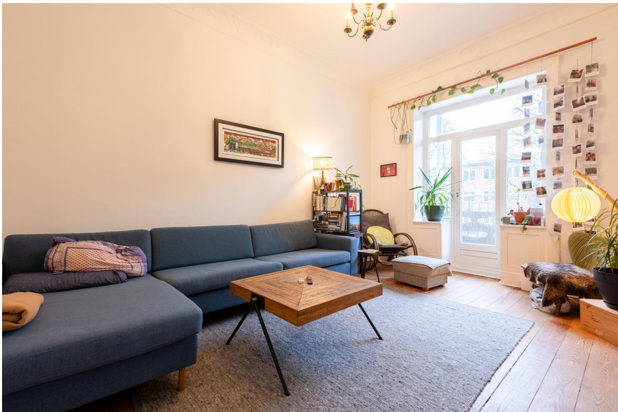
Zimmer 2 mit Balkon