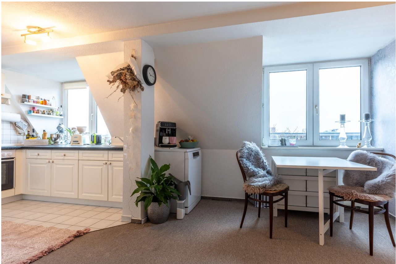
Wohnzimmer mit offener Küche