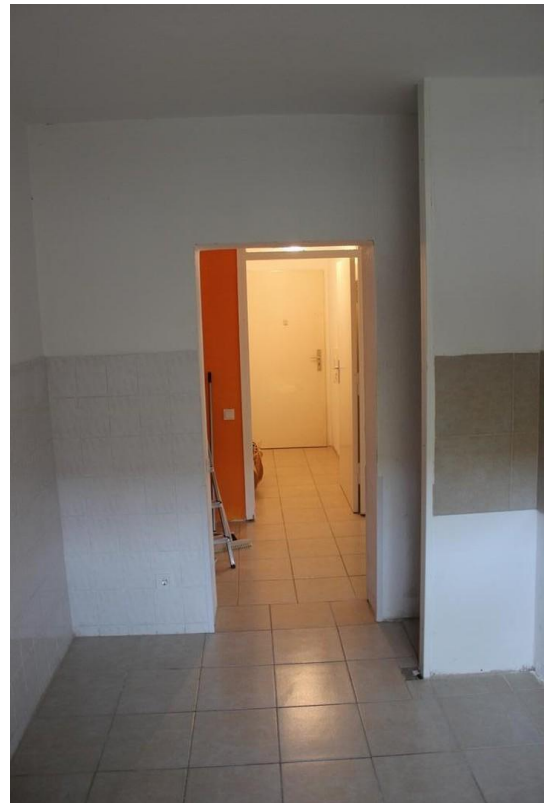
Küche, Eingang, Windfang