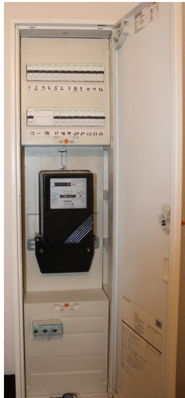
Elektroinstallation neu 2014