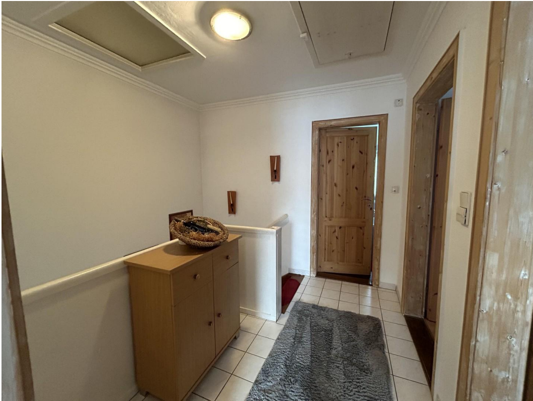
Flur im Obergeschoss