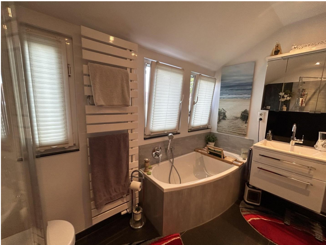
Wanne im Bad