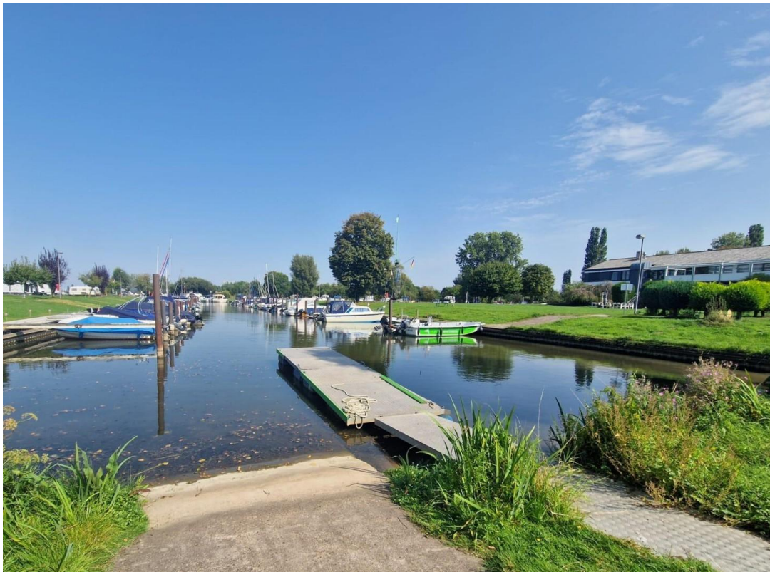
Sportboothafen um die Ecke