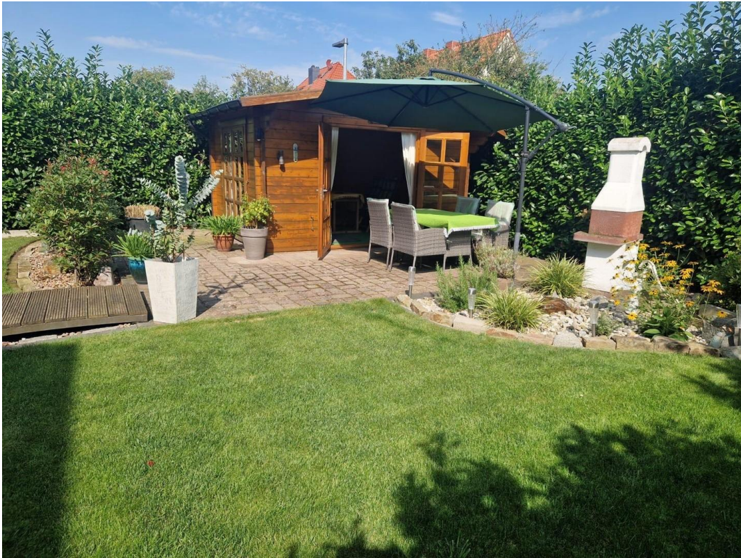
Gartenterrasse mit Blockhaus