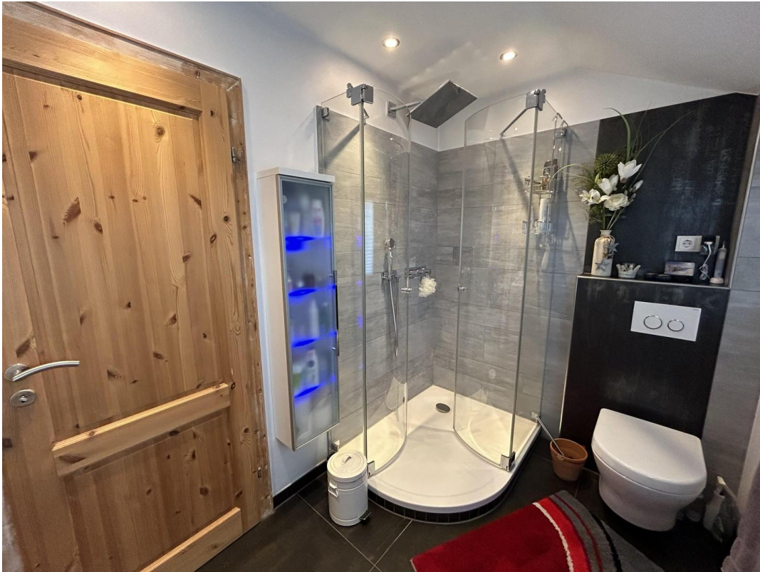
Dusche im Bad