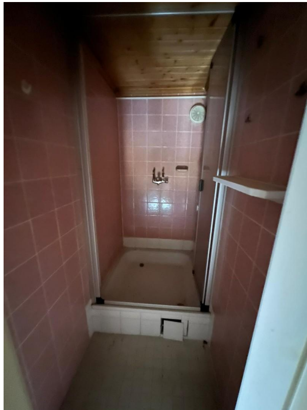
Dusche im DG