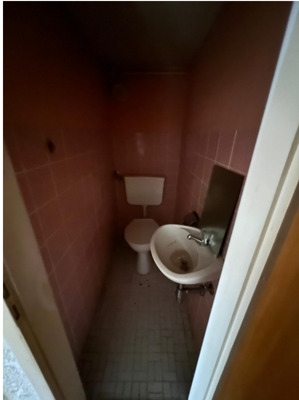
WC im DG