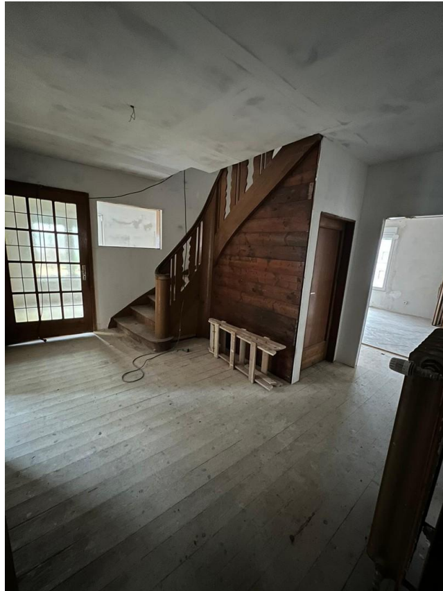
Diele und Treppe