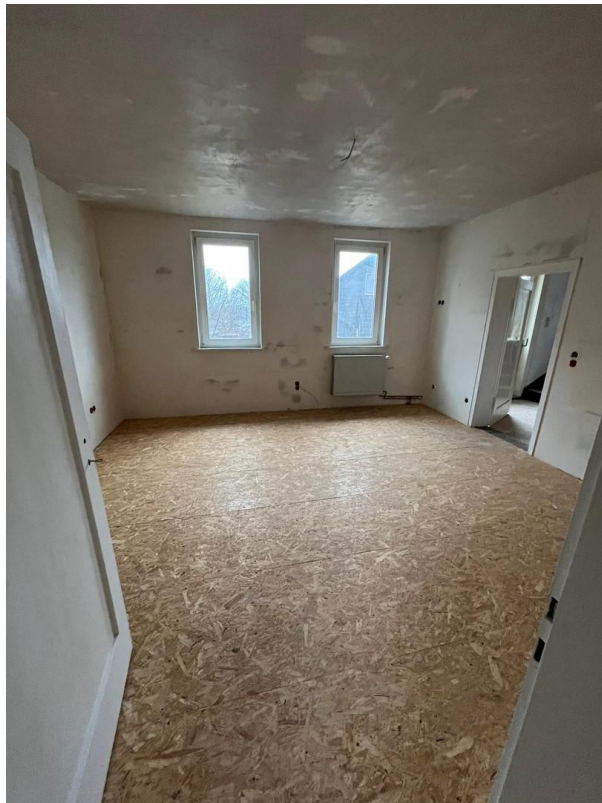
Zimmeransicht 1. OG