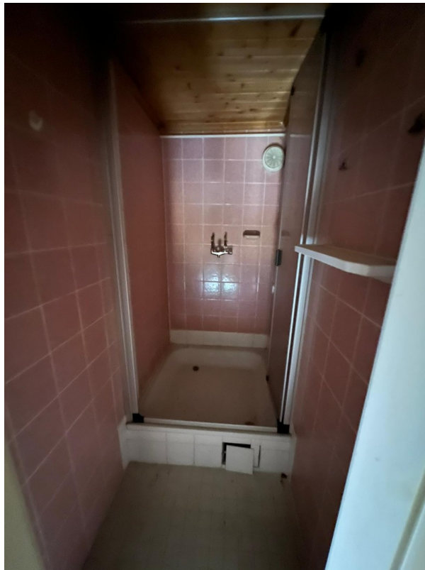
Dusche im DG