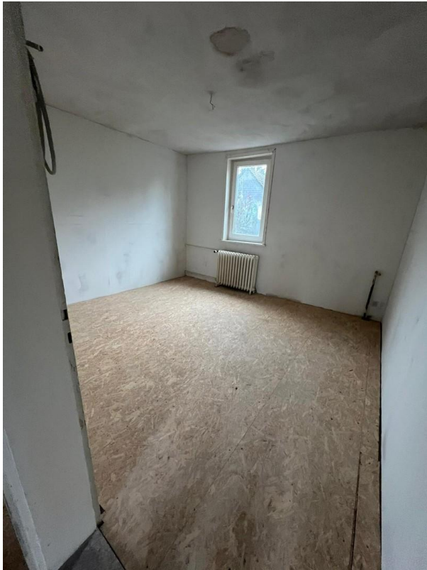
Zimmeransicht 1. OG