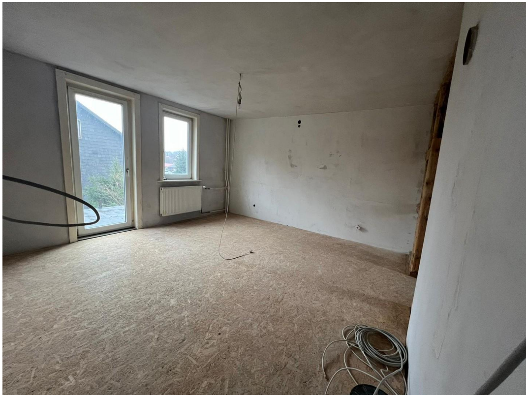
Zimmeransicht 1. OG