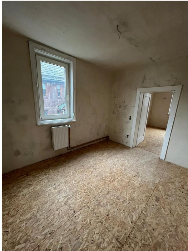
Zimmeransicht 1. OG