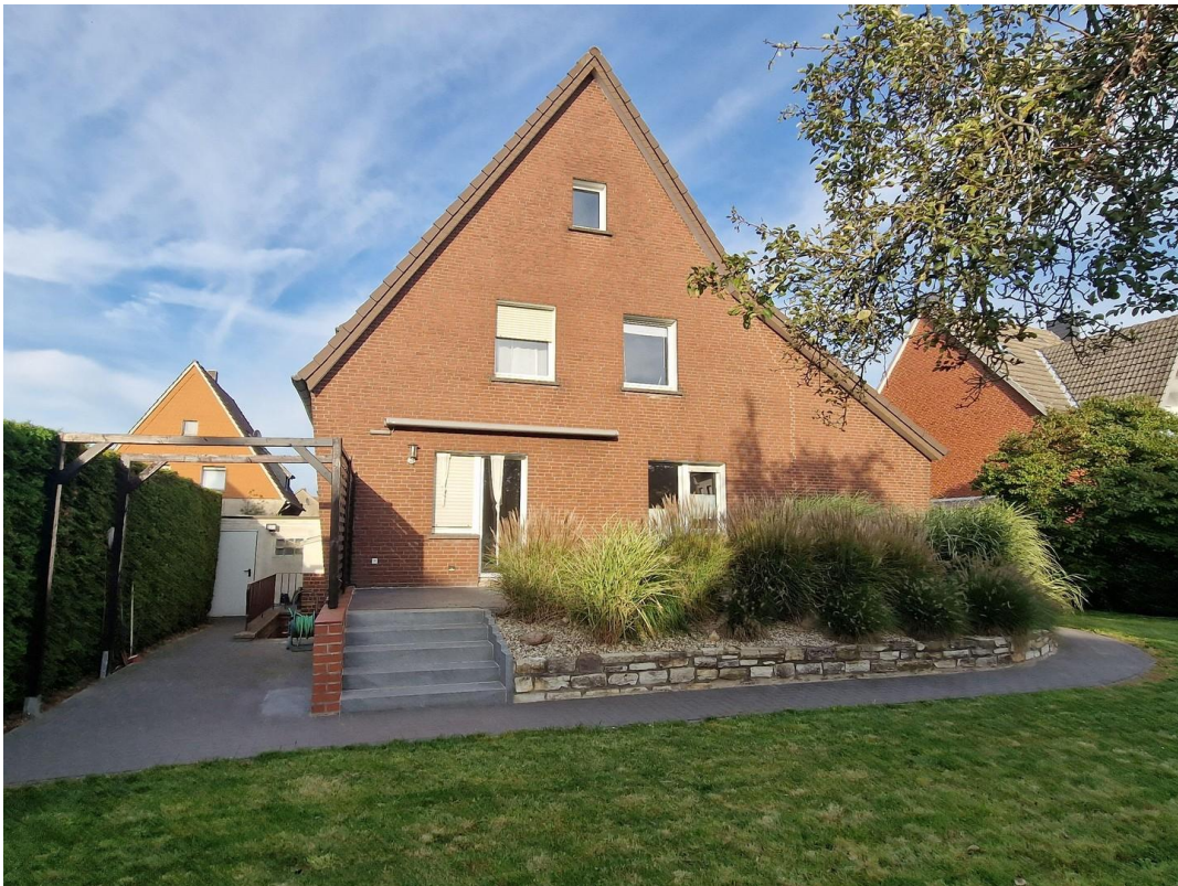
Die Sonne scheint