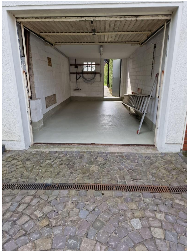
Garage mit Stellplatz davor