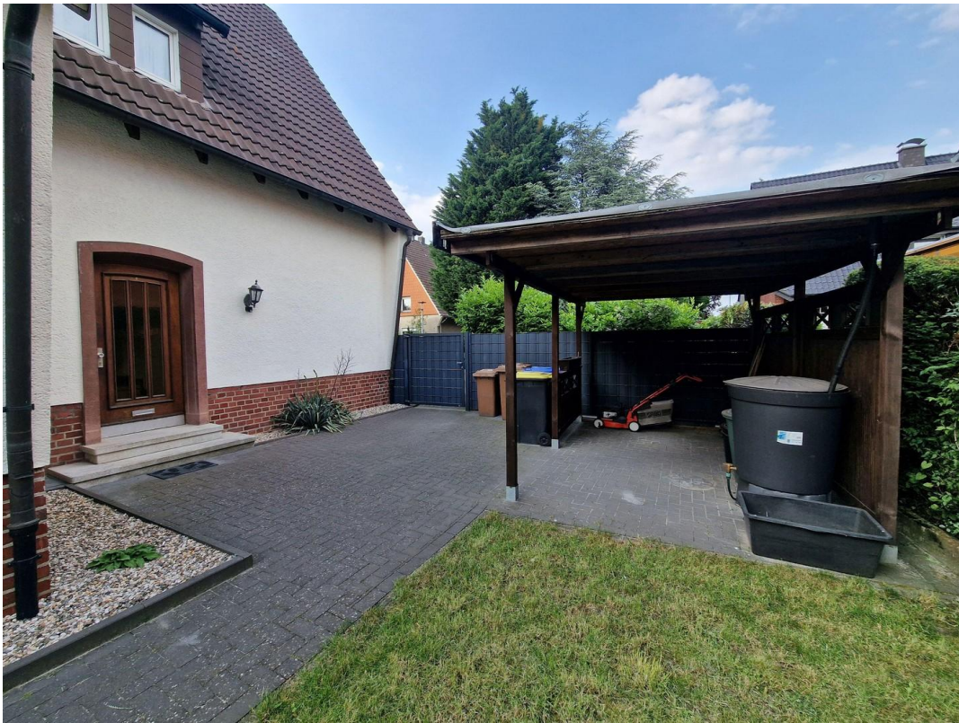
Carport für Fahrräder