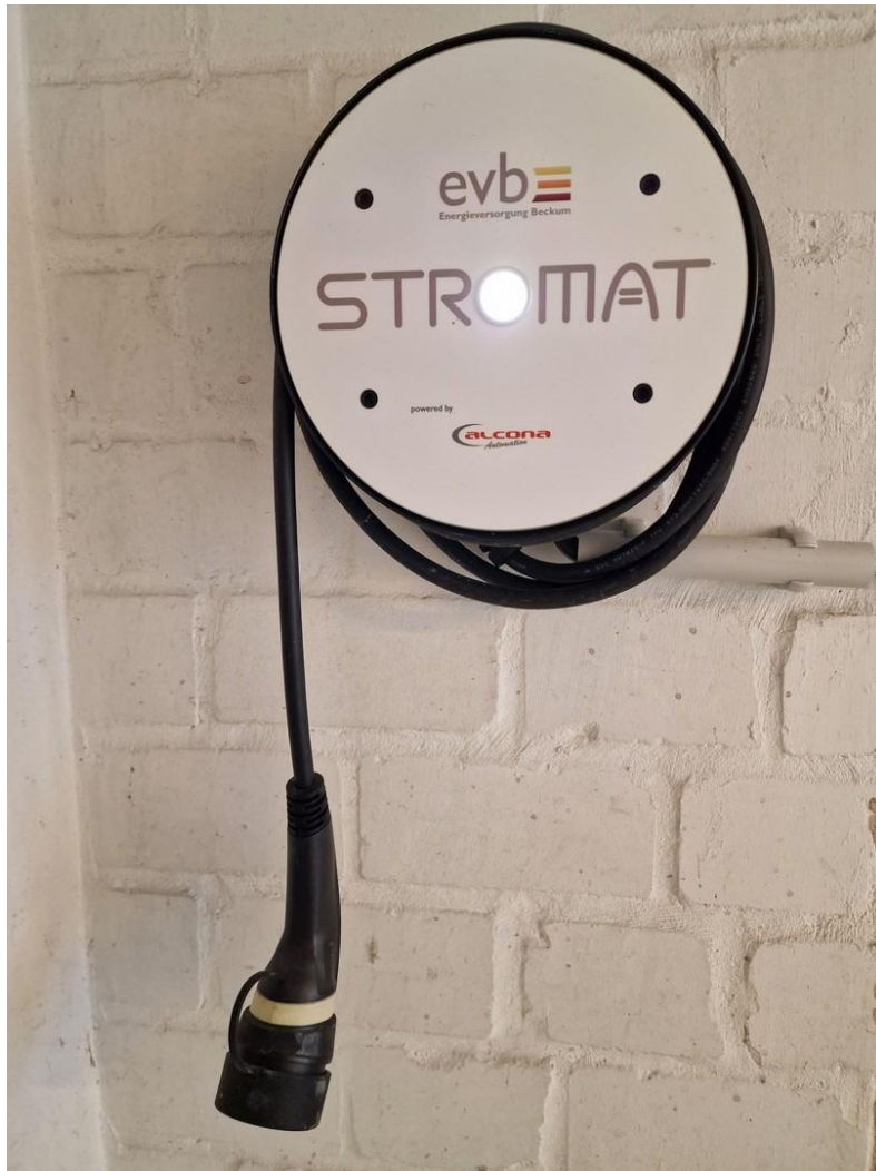
Wallbox in der Garage