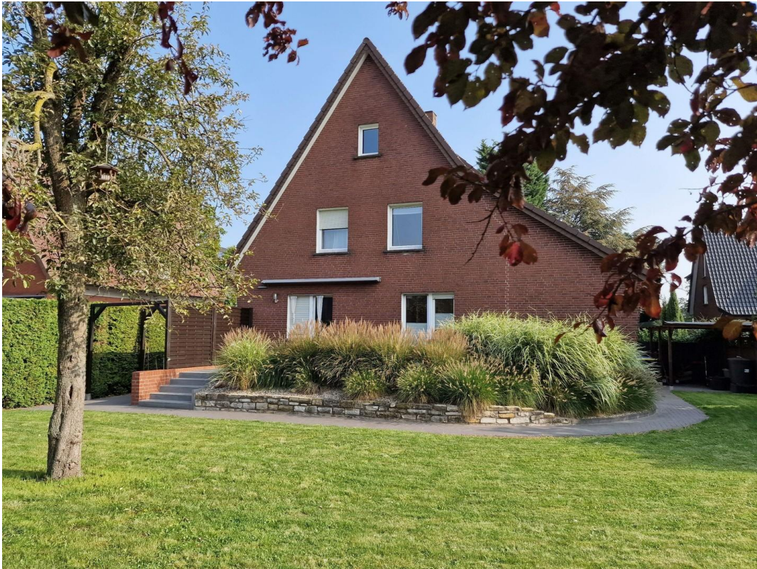
Blick vom Garten