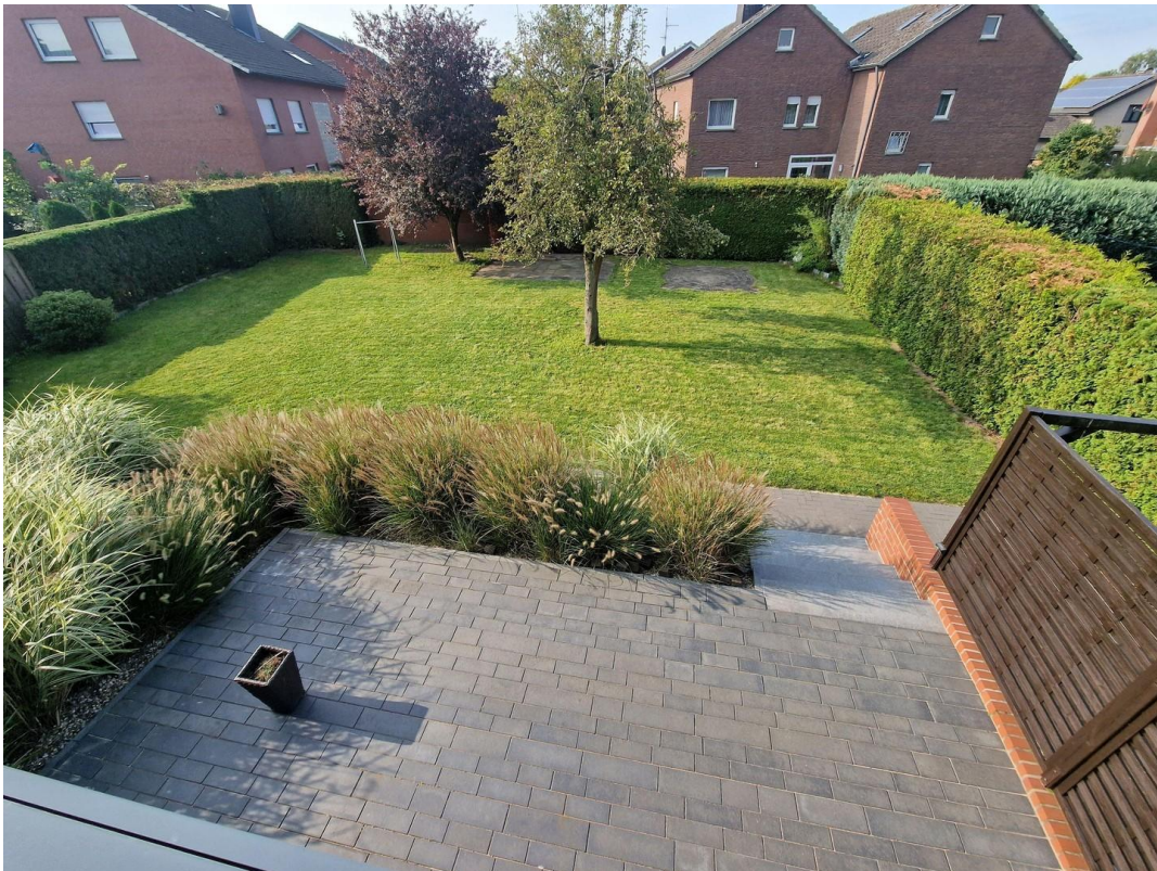
Blick vom OG in den Garten