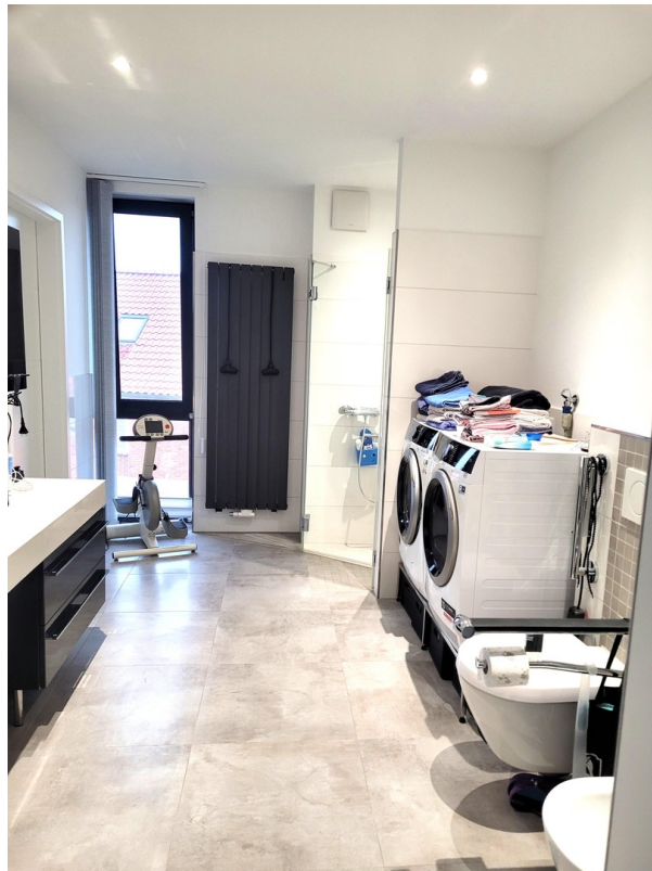
Bad m. seitr. Fenster