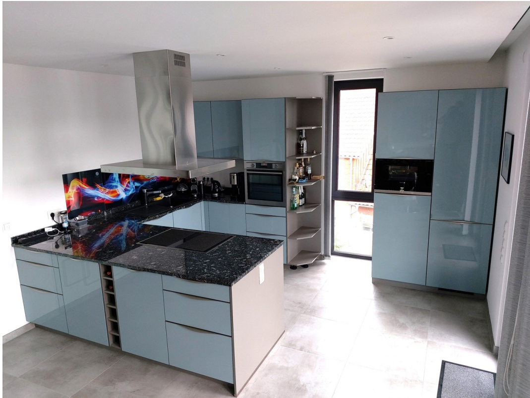
Küchenbereich m seittl. Fenster