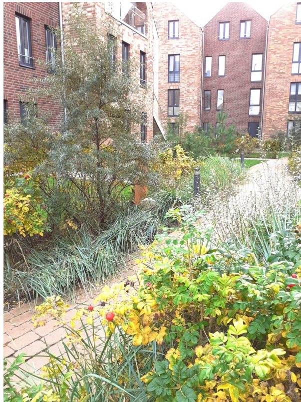
Innenhof zum Thulboden