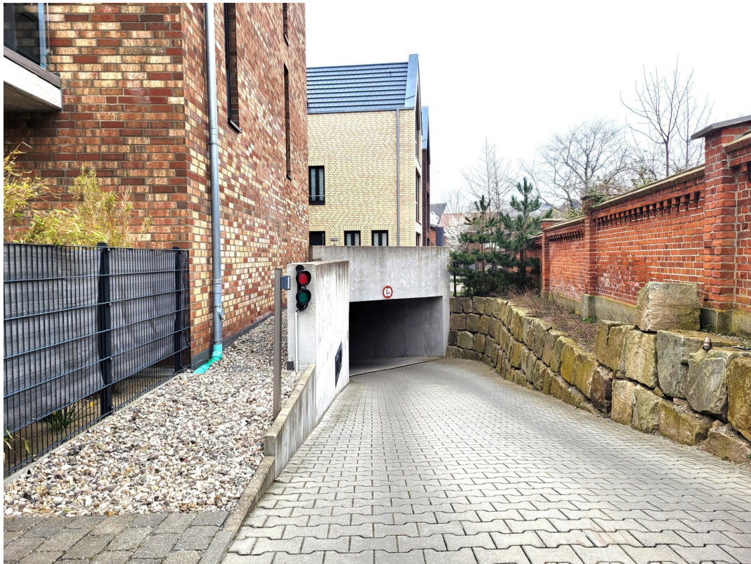
TG Ein- Ausfahrt