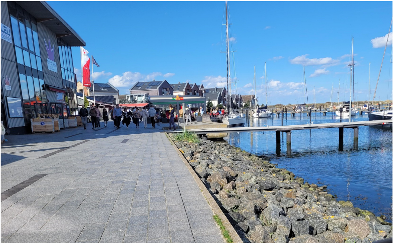
Promenade Richtung Seebrücke