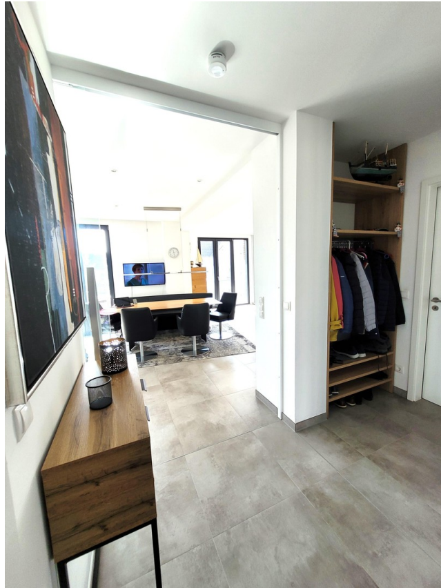
Eingangsbereich mit Garderobe