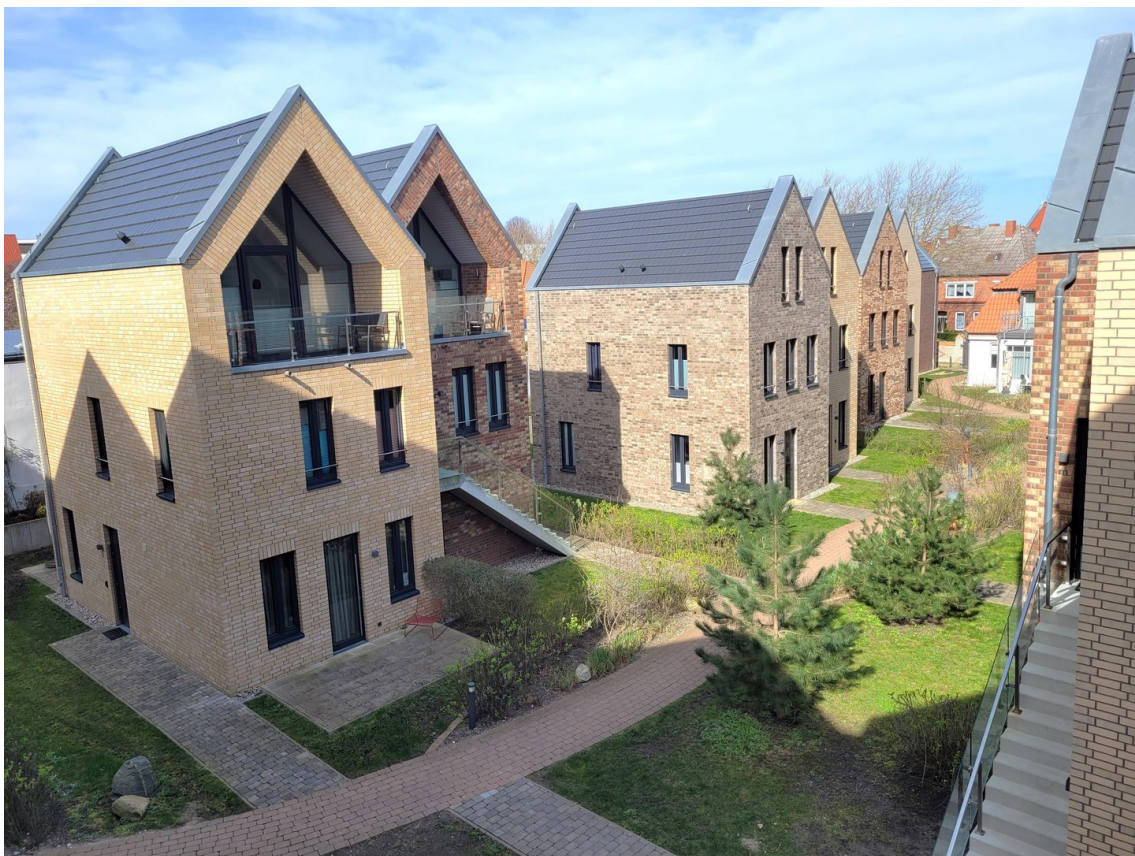
Blick aus SZ, zum Innenhof