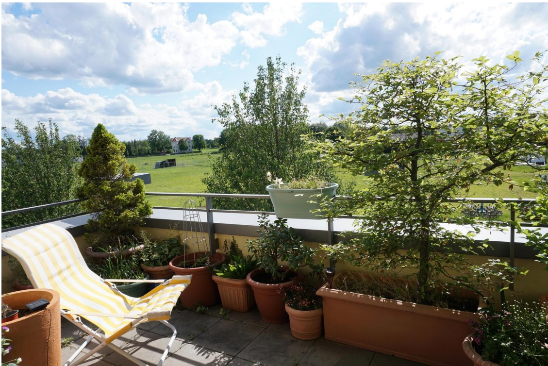
Ausblick nach Süden/Westen