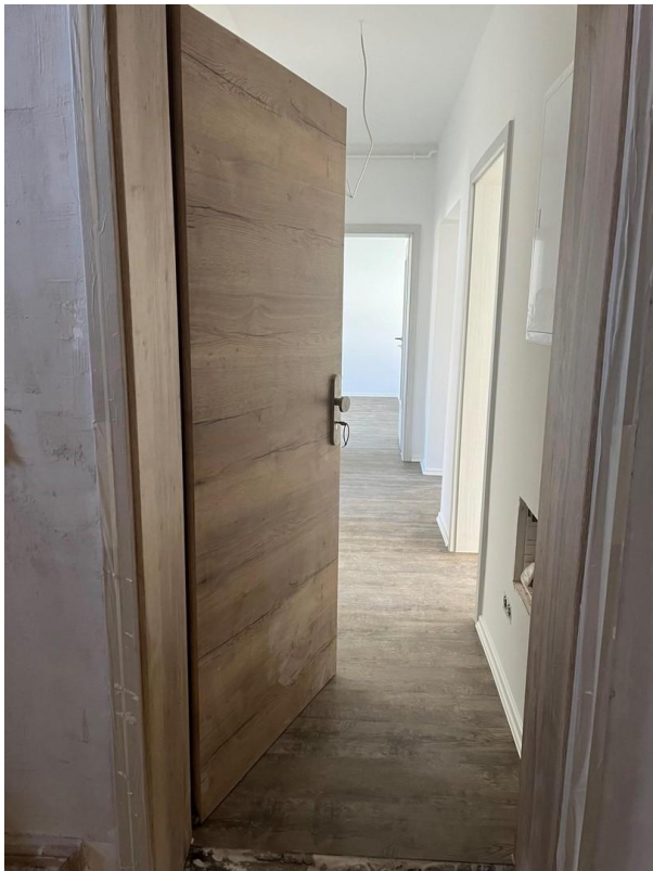
Beispiel Eingangstür / Fußboden