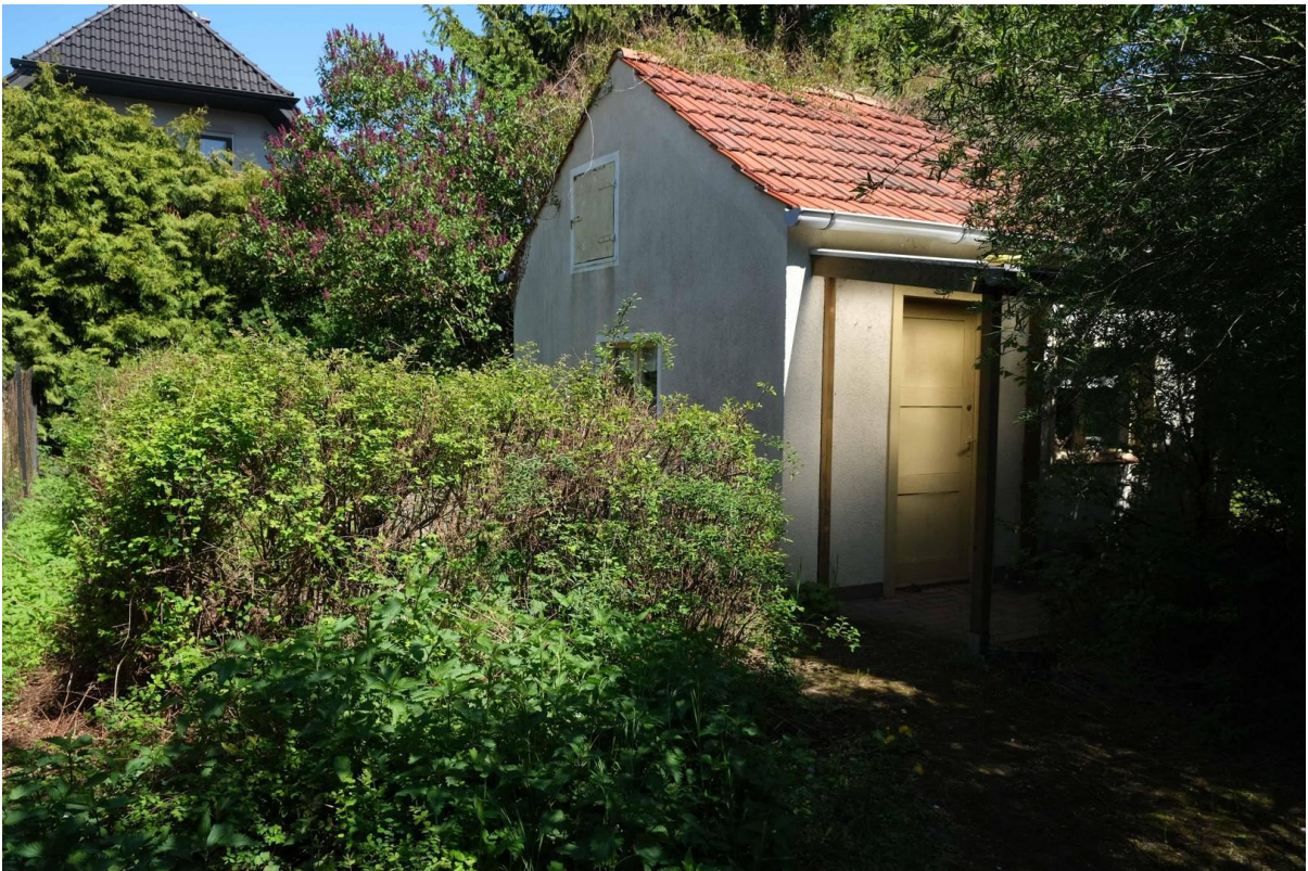
Eingang zum Haus