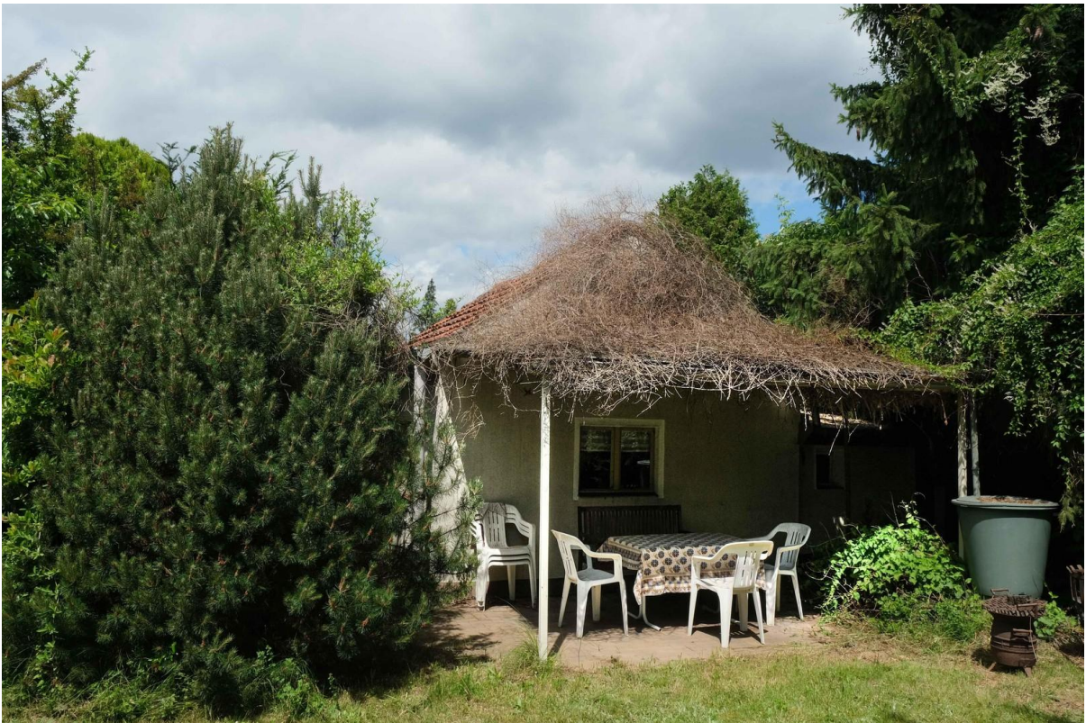
Terrasse & Haus