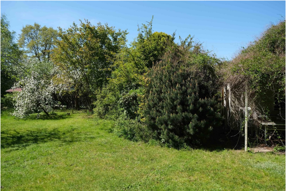
Wiese mit Terrassenecke