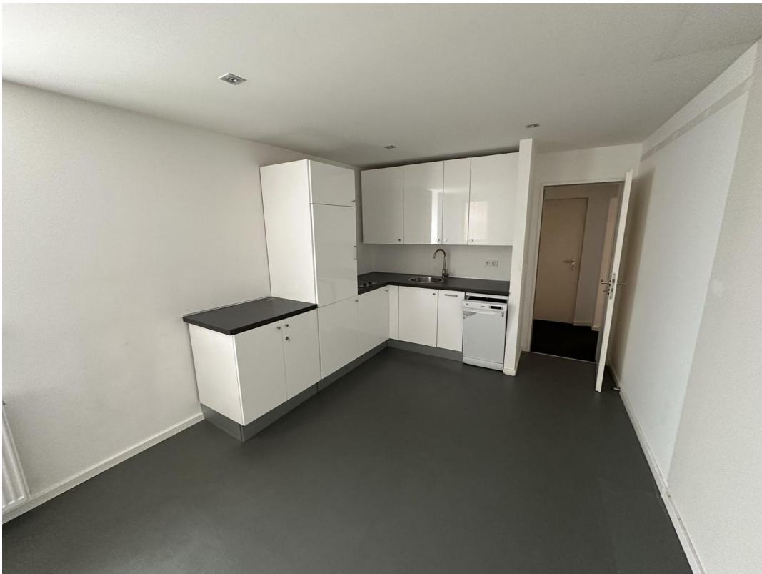
Küche und Aufenthaltsraum