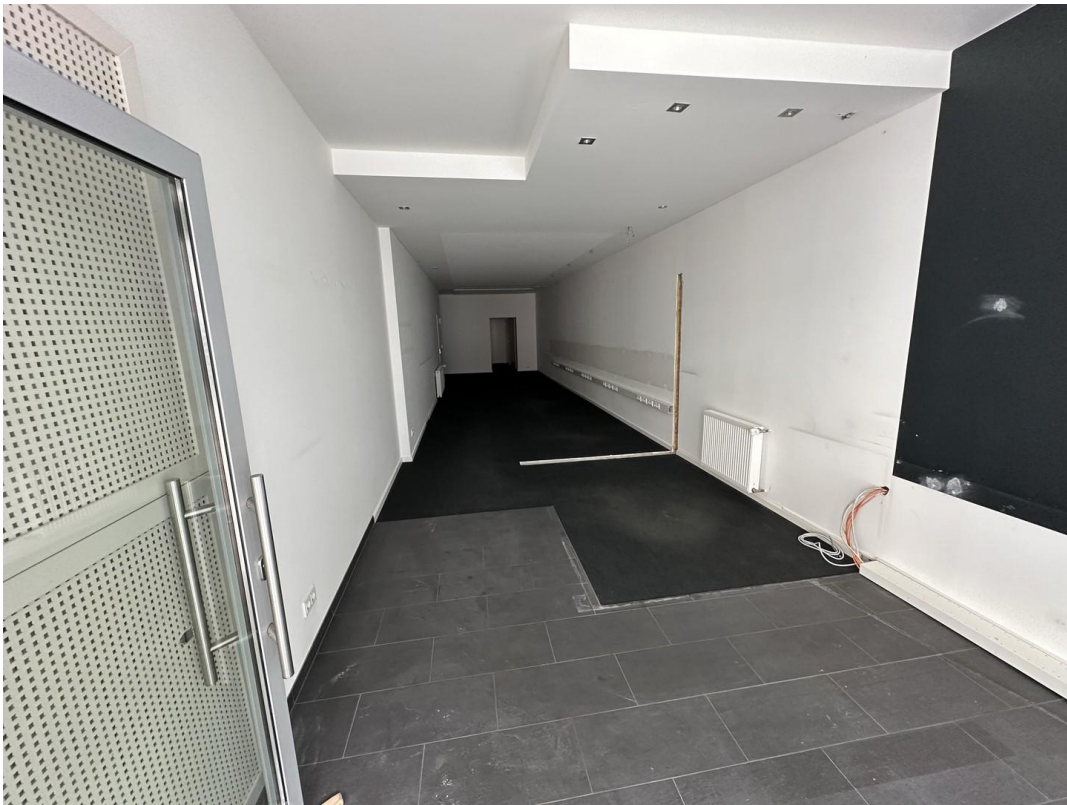
Blick in den Verkaufsraum