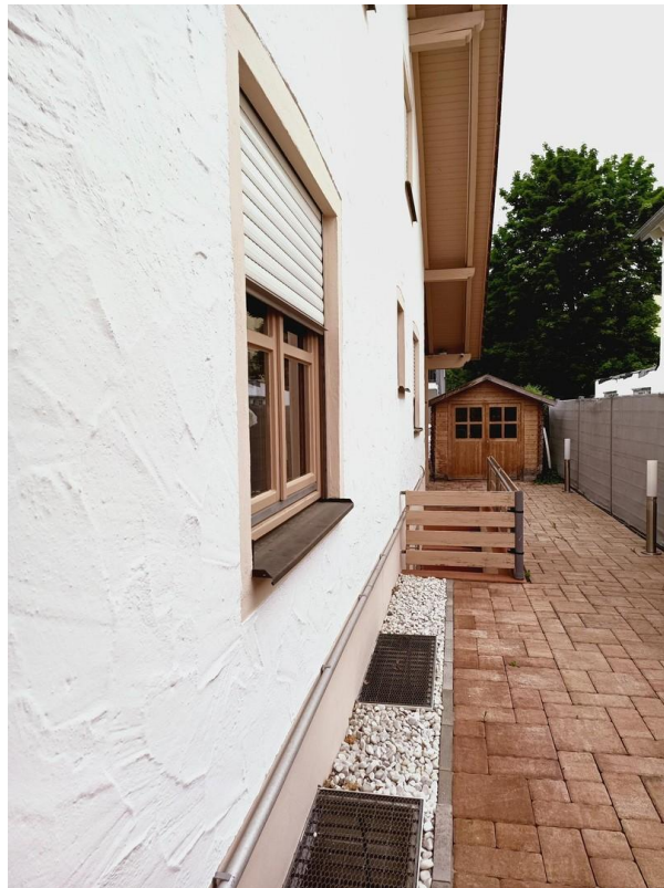
Ostseite mit Kellereingang