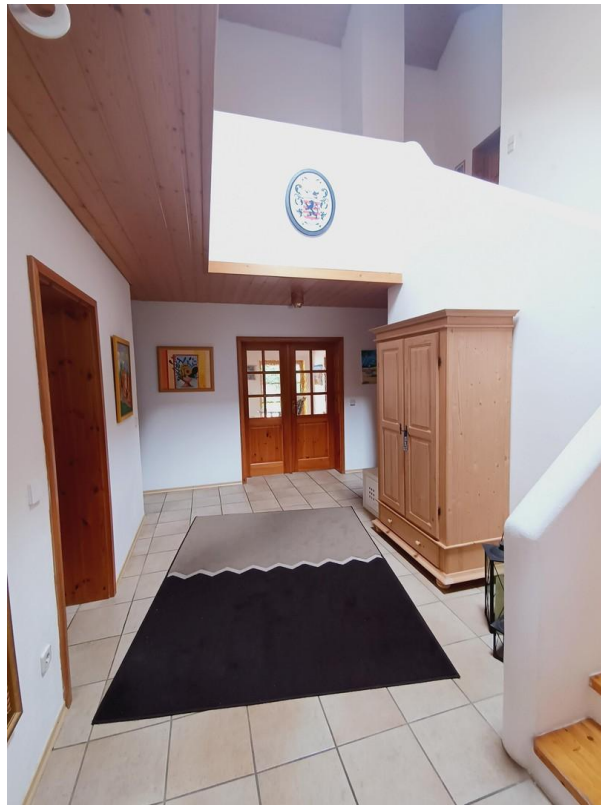
Eingang / Diele