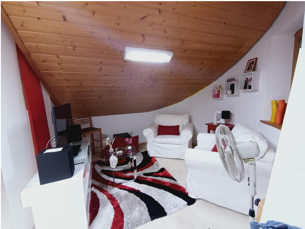
Sitzecke Arbeitszimmer oben