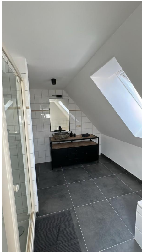
Bad - Waschtisch