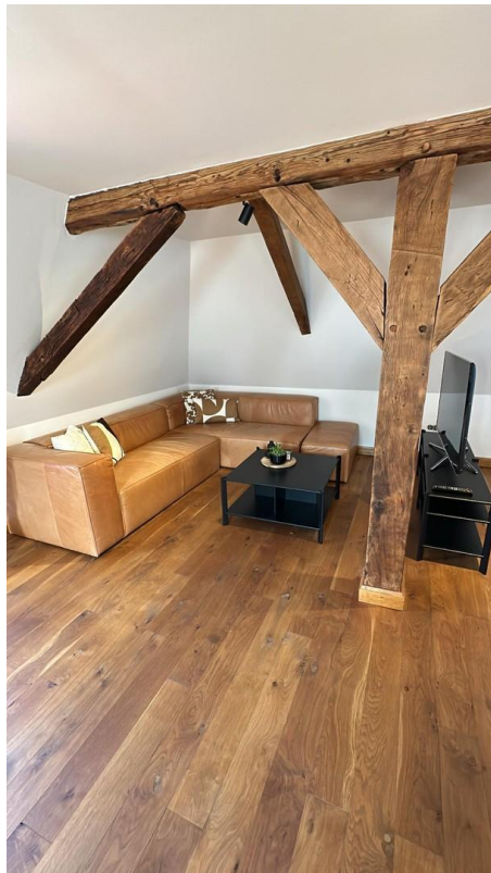
Wohnzimmer - Sofa