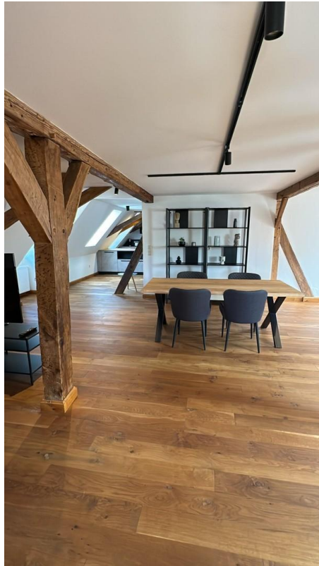
Wohnzimmer - Essbereich