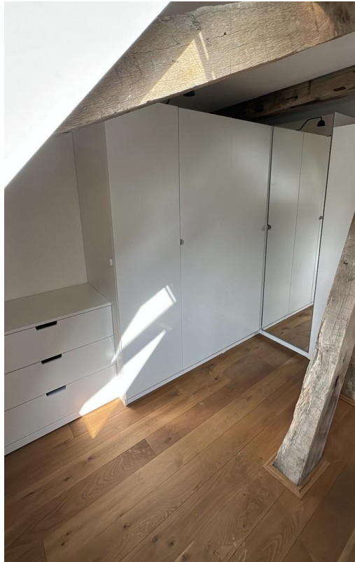
Schlafzimmer - Kleiderschrank