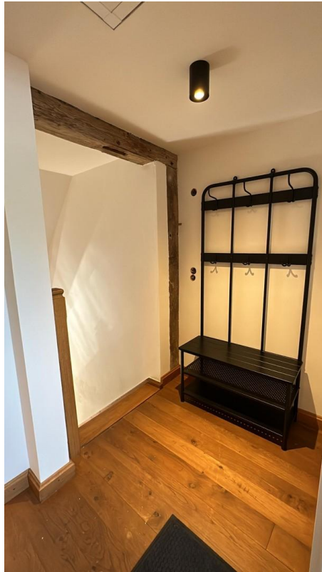
Flur - Garderobe