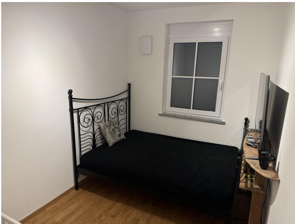
Kinder oder Hobbyzimmer