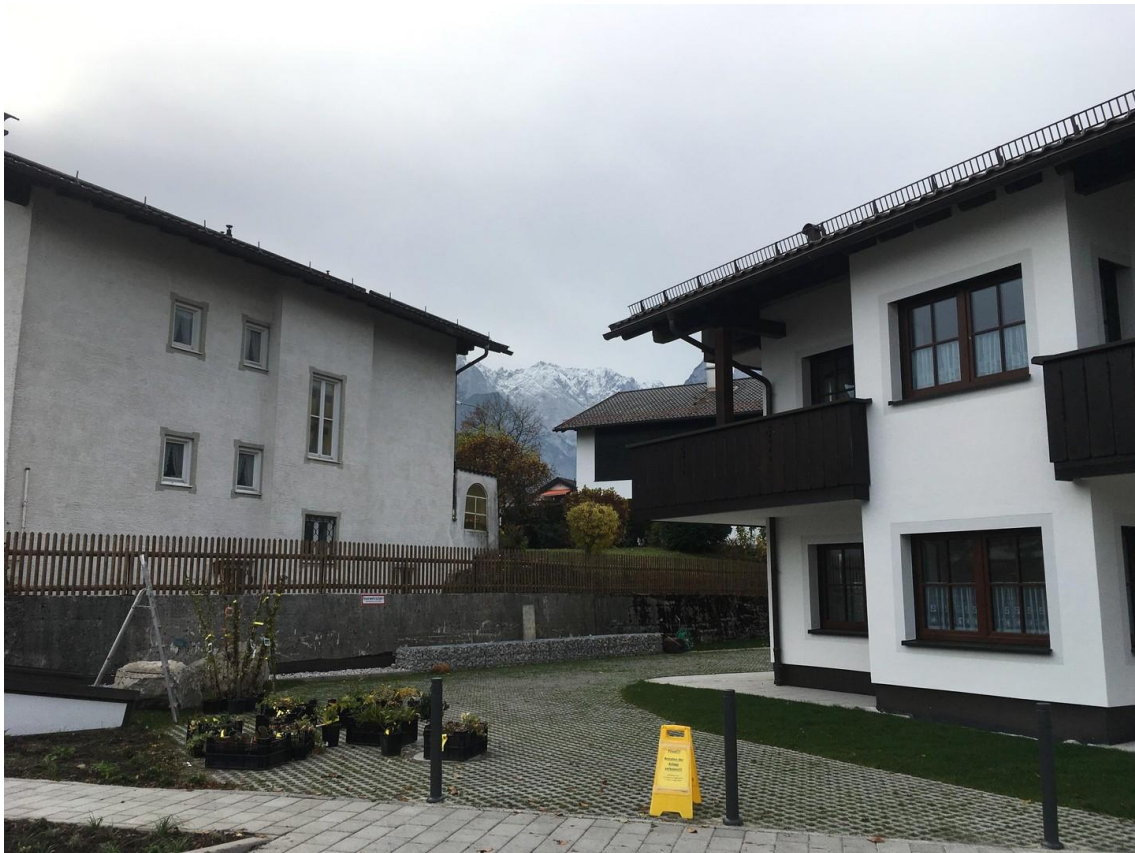
Eingang zum Garten