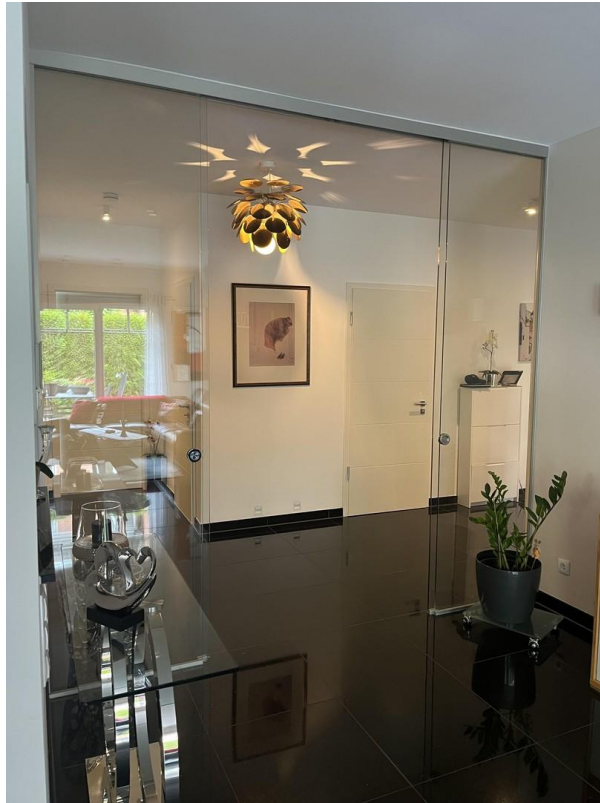
Blick vom Wohnzimmer zum Flur