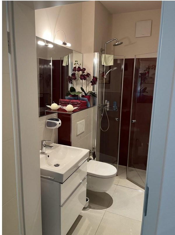
Gästebad mit Dusche