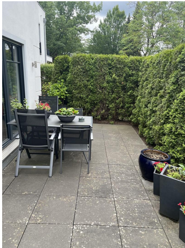
eine von drei Terrassen