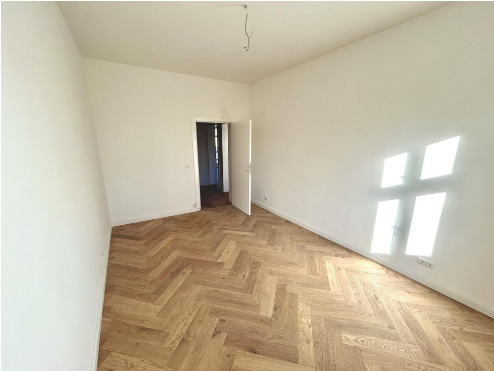
Arbeitszimmer zur Tür