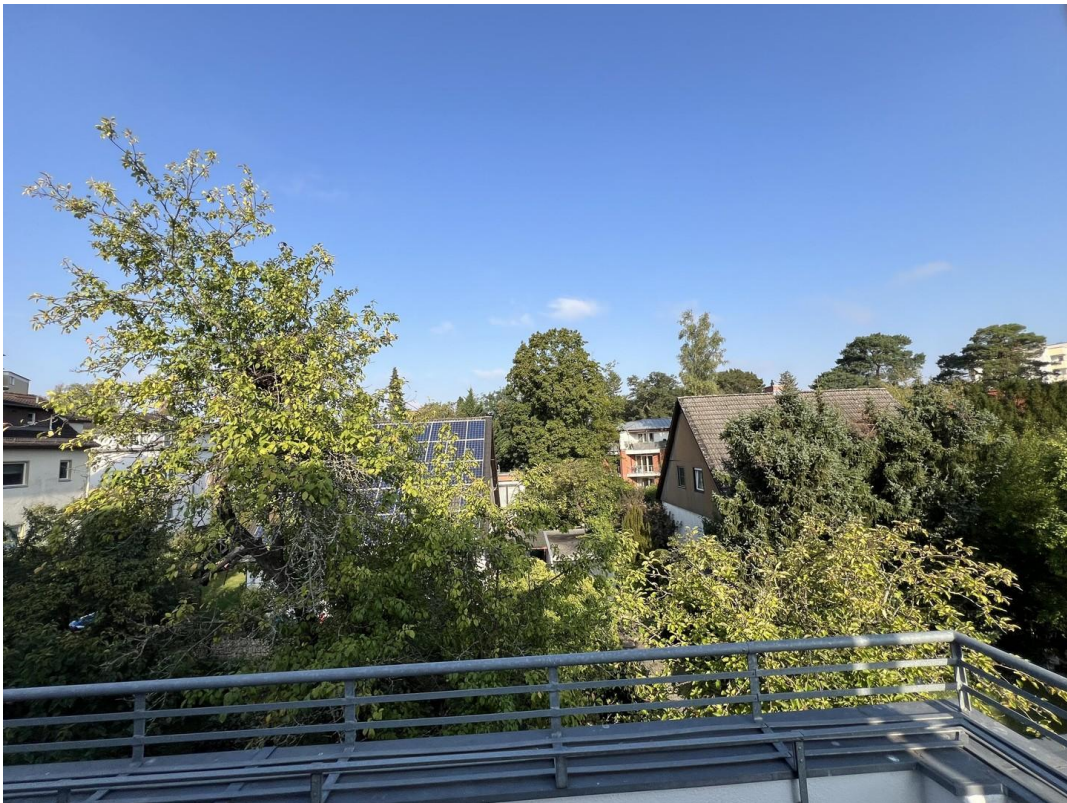
Balcony view garden