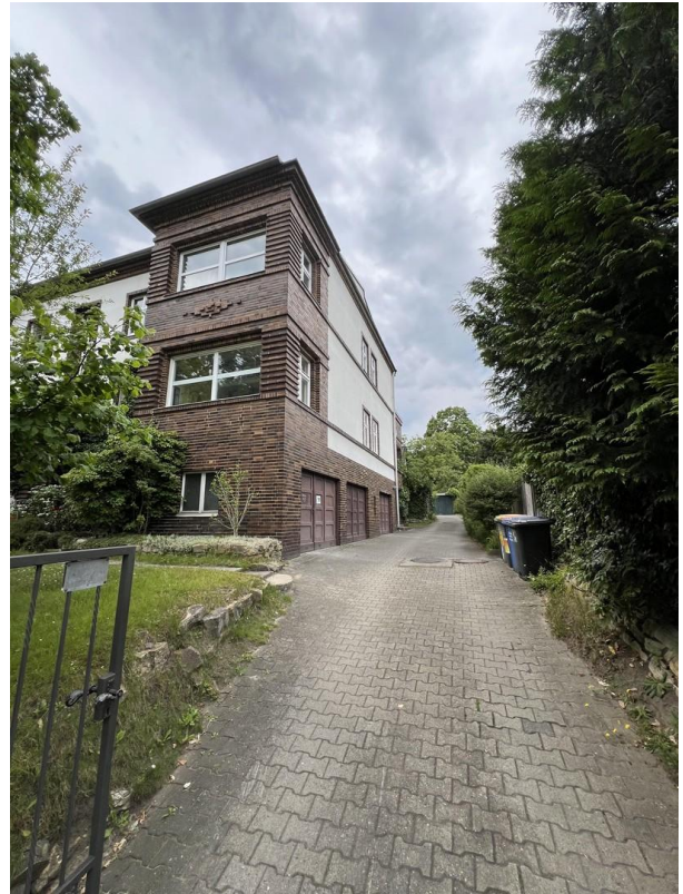
Way to garage