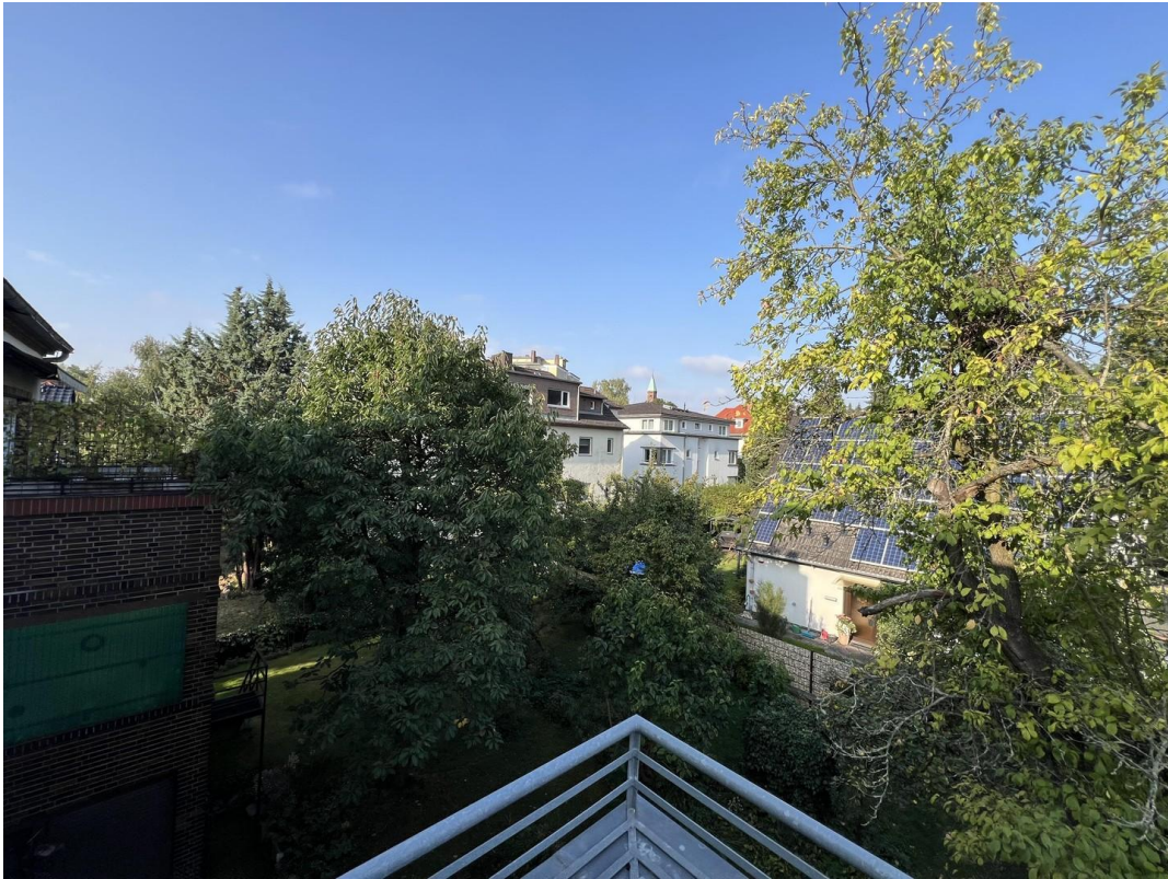
Balcony view garden