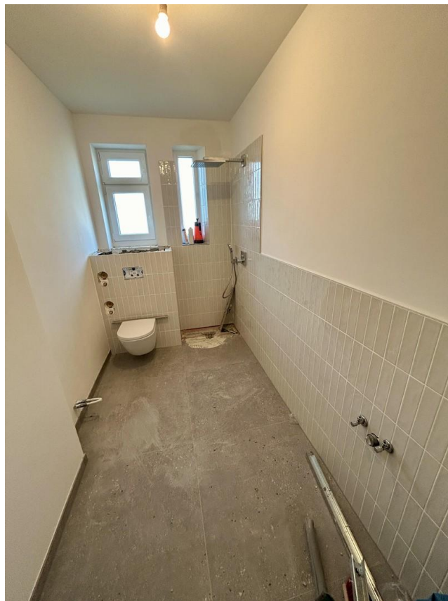
Badezimmer (im Umbau)