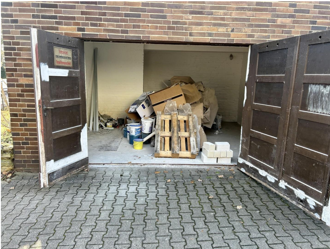
Blick in Garage