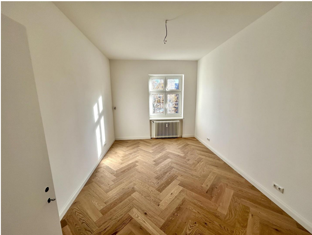
Arbeitszimmer zum Fenster