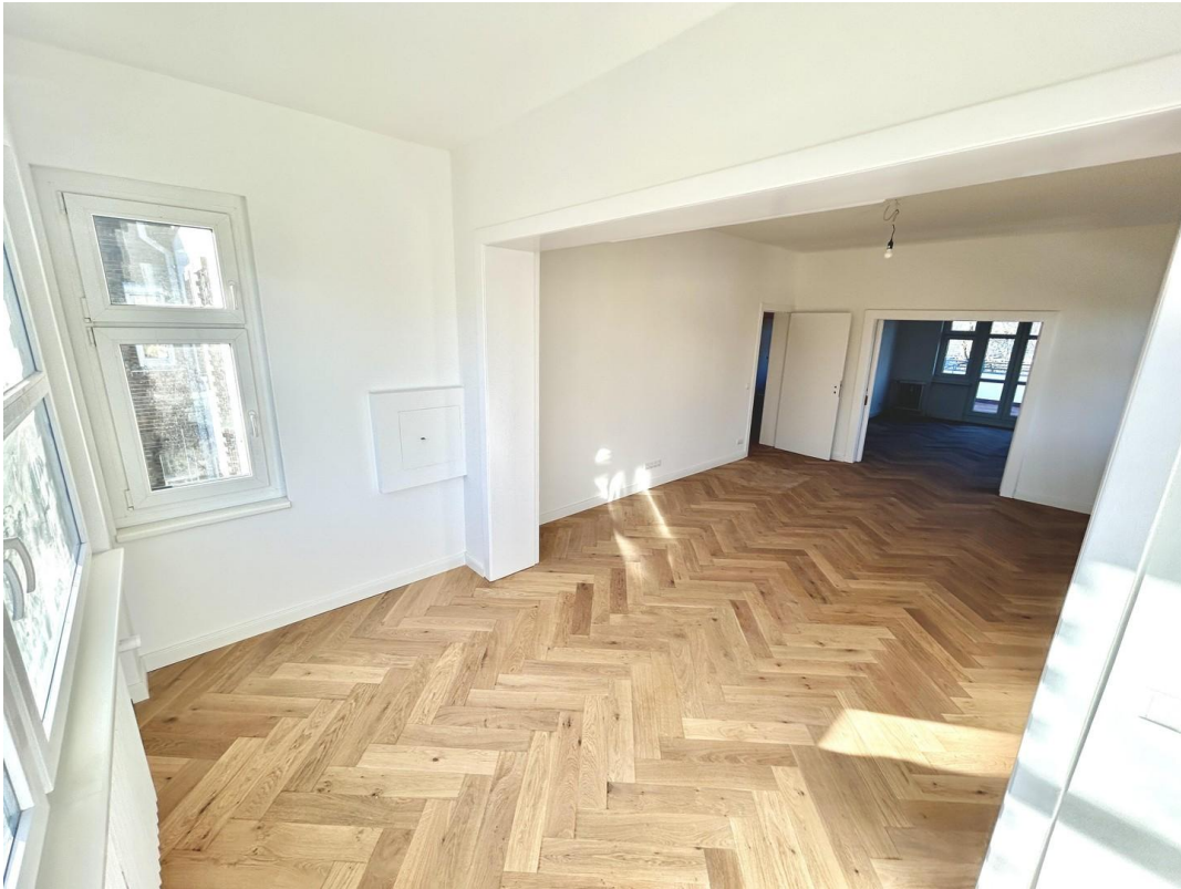
Durchgehendes Wohn- & Schlafzi