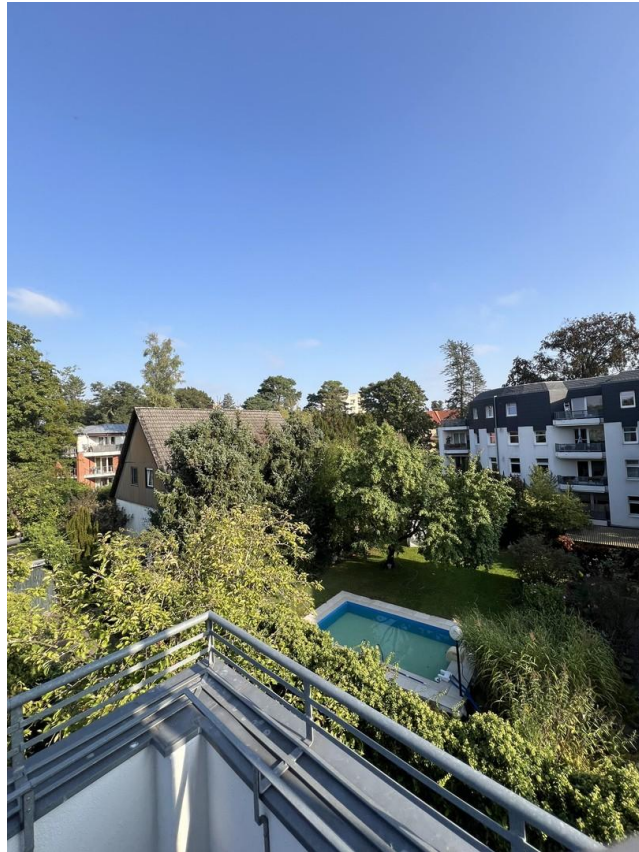
Balcony view neighbors