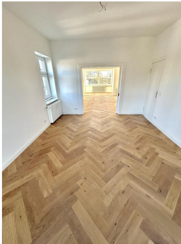
Durchgehendes Wohn- & Schlafzi