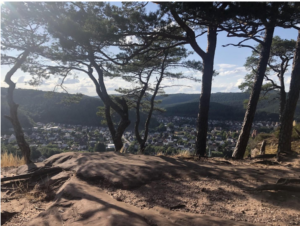
Ausblick auf Hauenstein