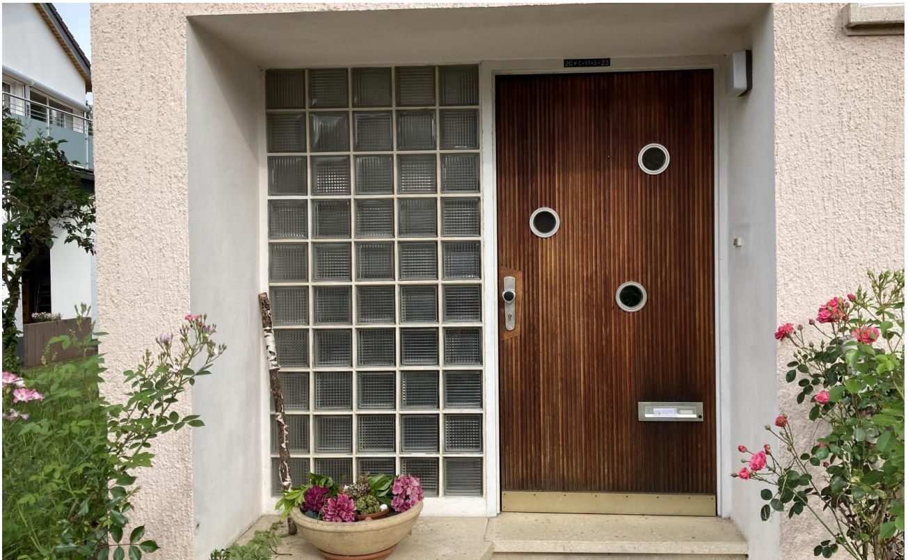
Hauseingang, 60 Jahre