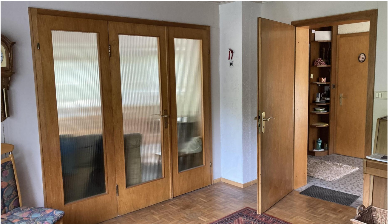
Wohnzimmer; zum Esszimmer+Flur