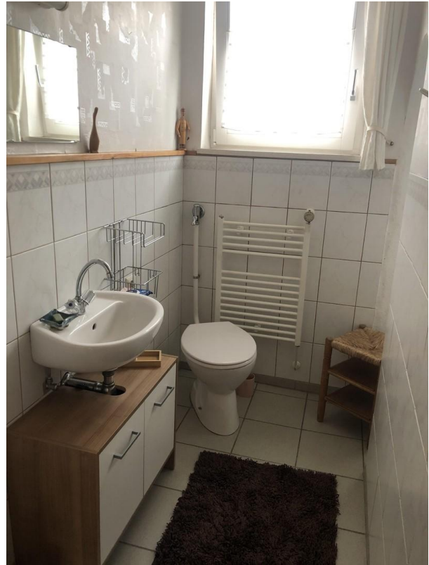
Gäste WC und Dusche