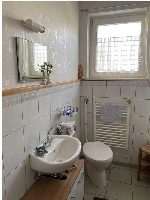
EG; Gäste WC mit Dusche