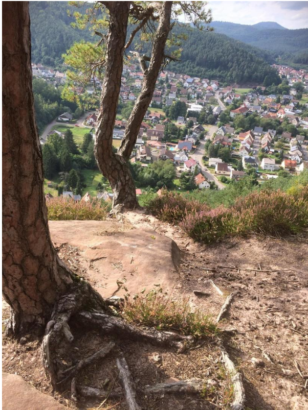
Ausblick vom Felsen