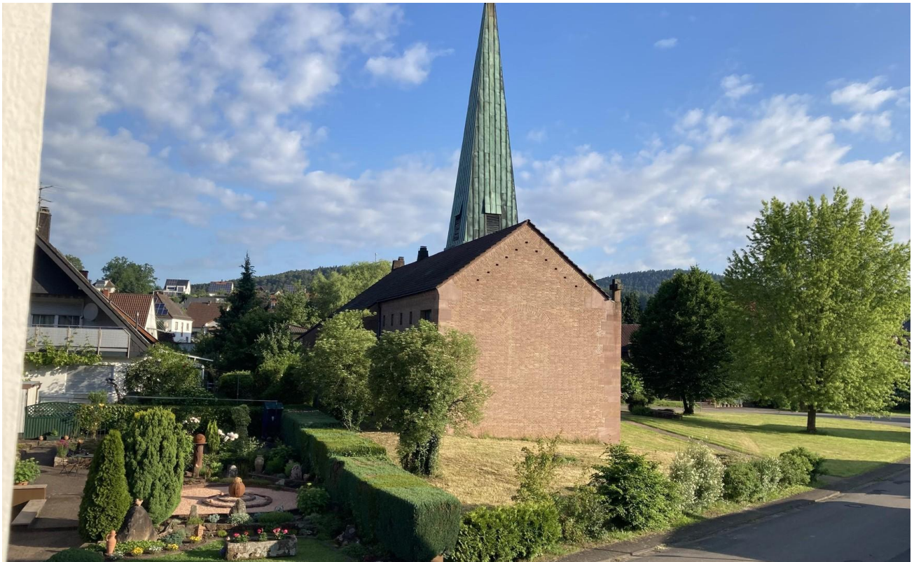
Ev.Kirche, läutet sehr selten!