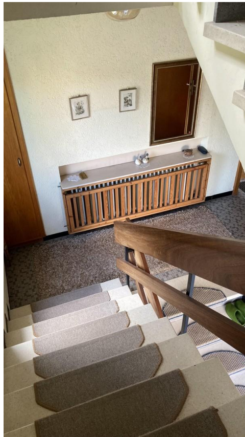
Treppe nach Oben