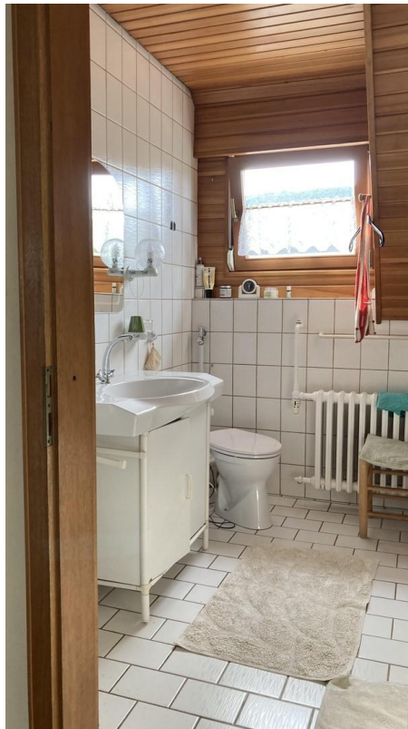
Bad, links Waschbecken