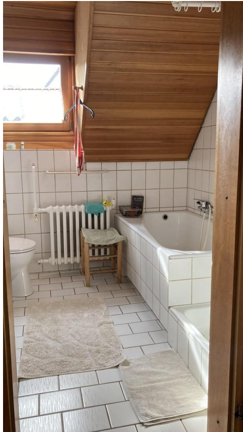
Bad, rechts Wanne