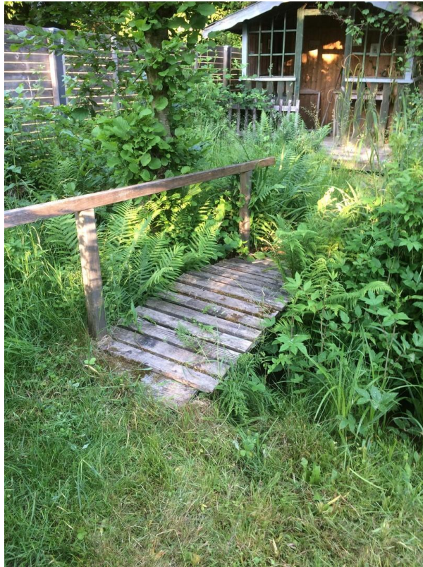
Brücke zum Nutzgarten