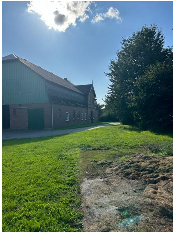
Ansicht Richtung Ausfahrt