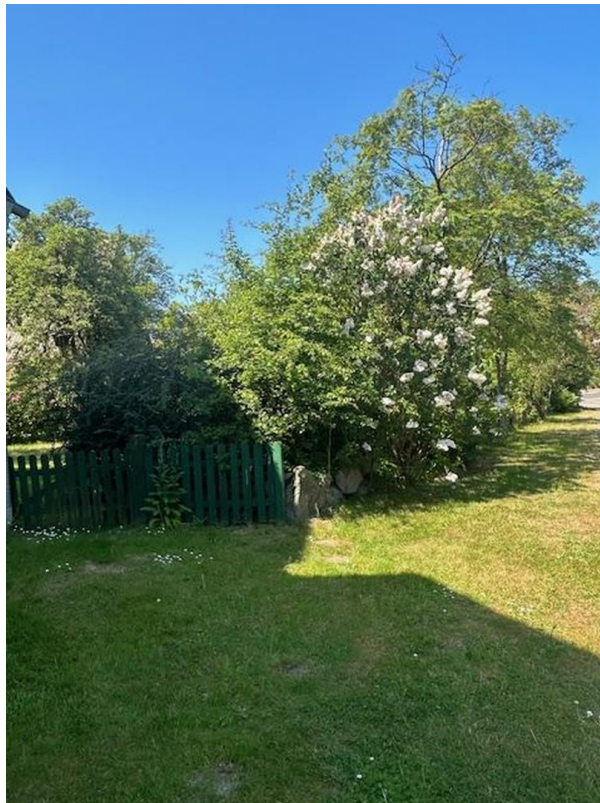
Eingang zum Vorgarten