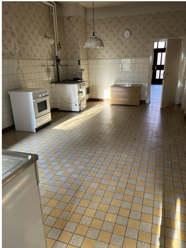
Küche mit Ofen