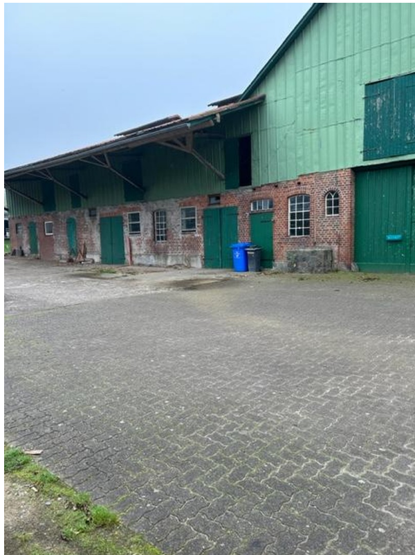
Rückseite Diele und Kuhstall