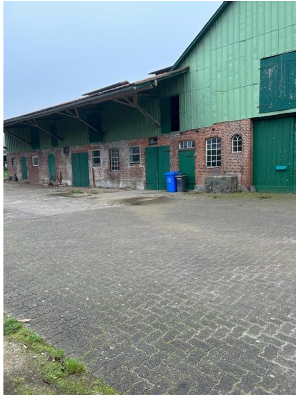
Rückseite Diele und Kuhstall