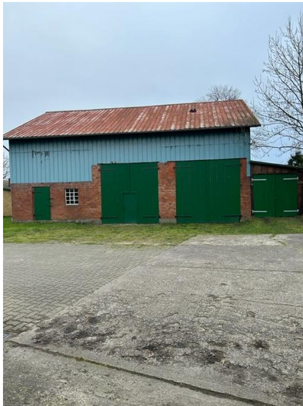
Schuppen und Garage