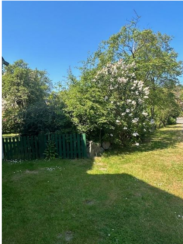
Eingang zum Vorgarten