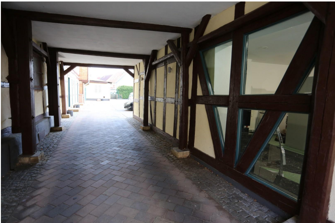
Durchgang zum Innenbereich