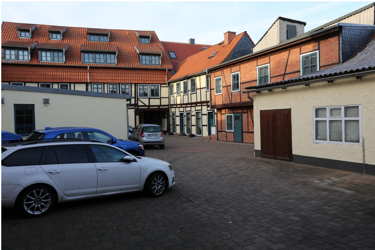
WG rechts, nach dem Durchgang