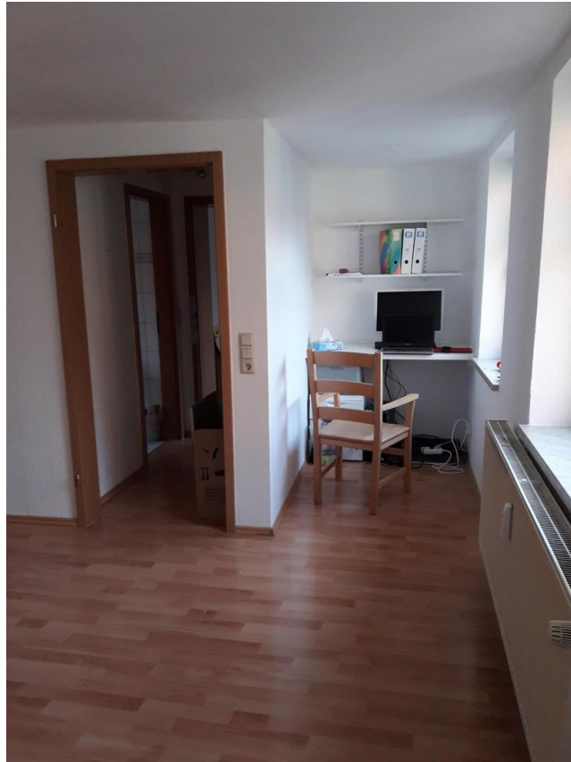
Arbeitsplatz im Wohnzimmer