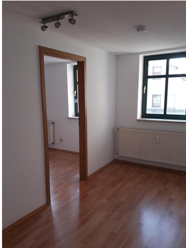
Tür vom Schlafz zum Wohnzimmer