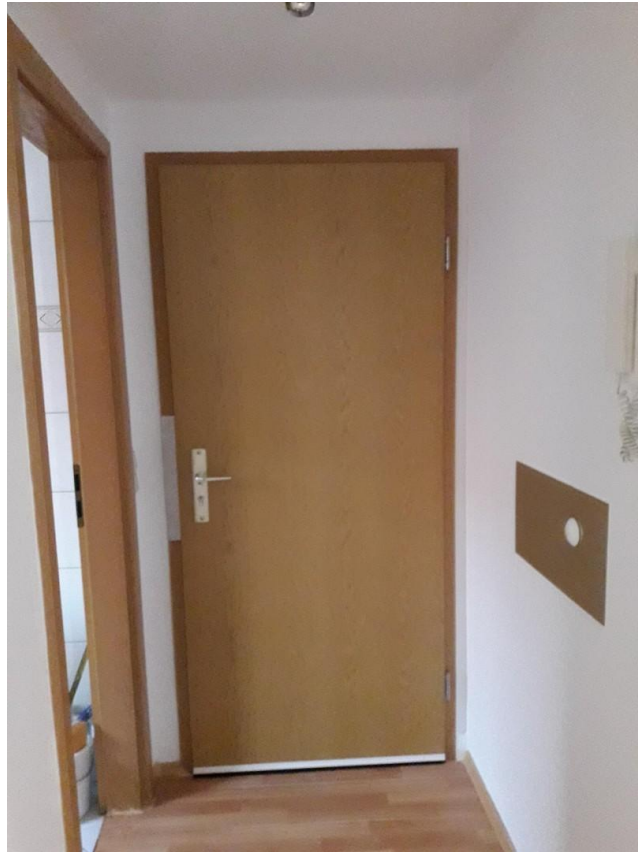
Wohnungseingang von Innen