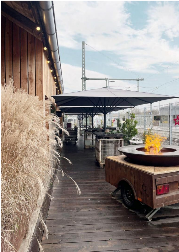
Außenbereich Bahnseite III