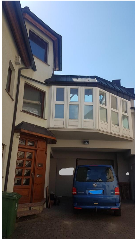
Hof mit Carport