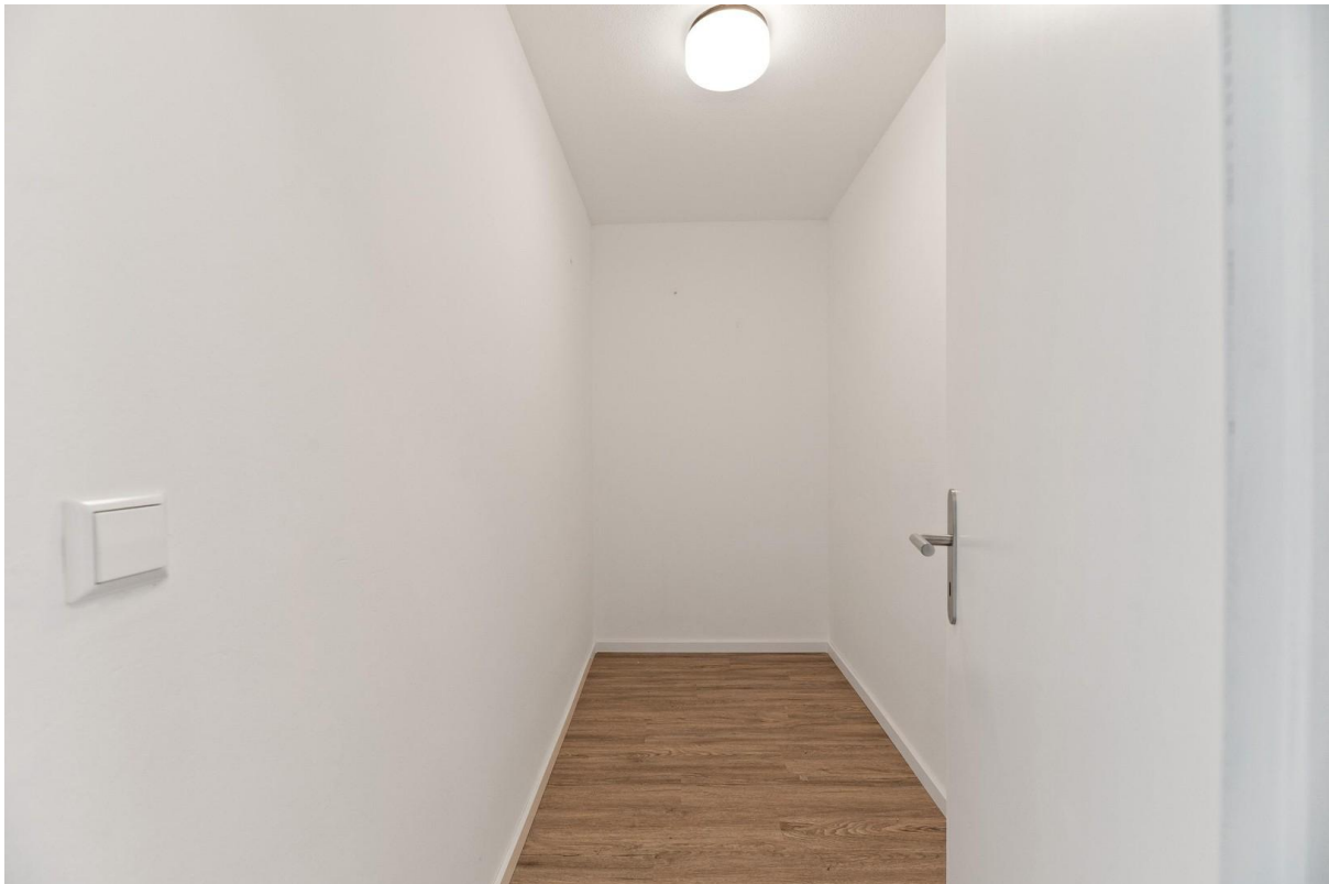
Abstellraum o. Kleiderschrank