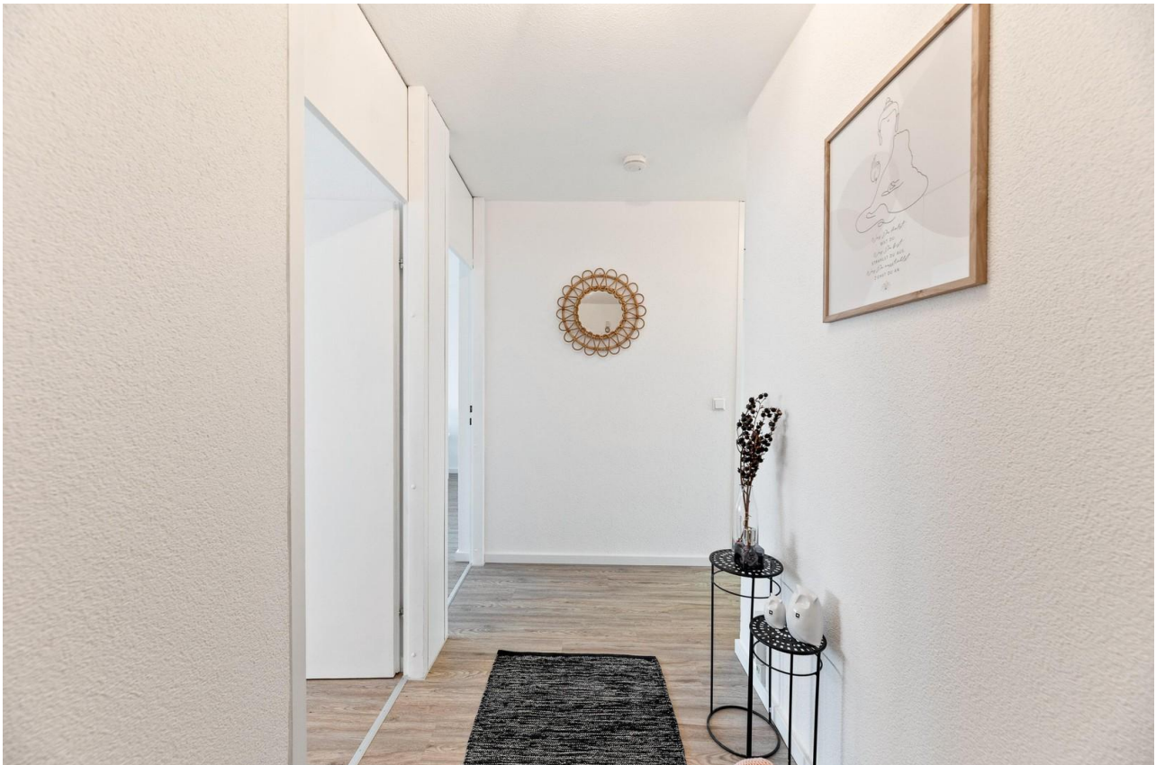
Vorsaal - endlich zu Hause