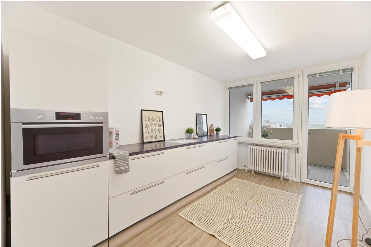
große Küche mit Balkon