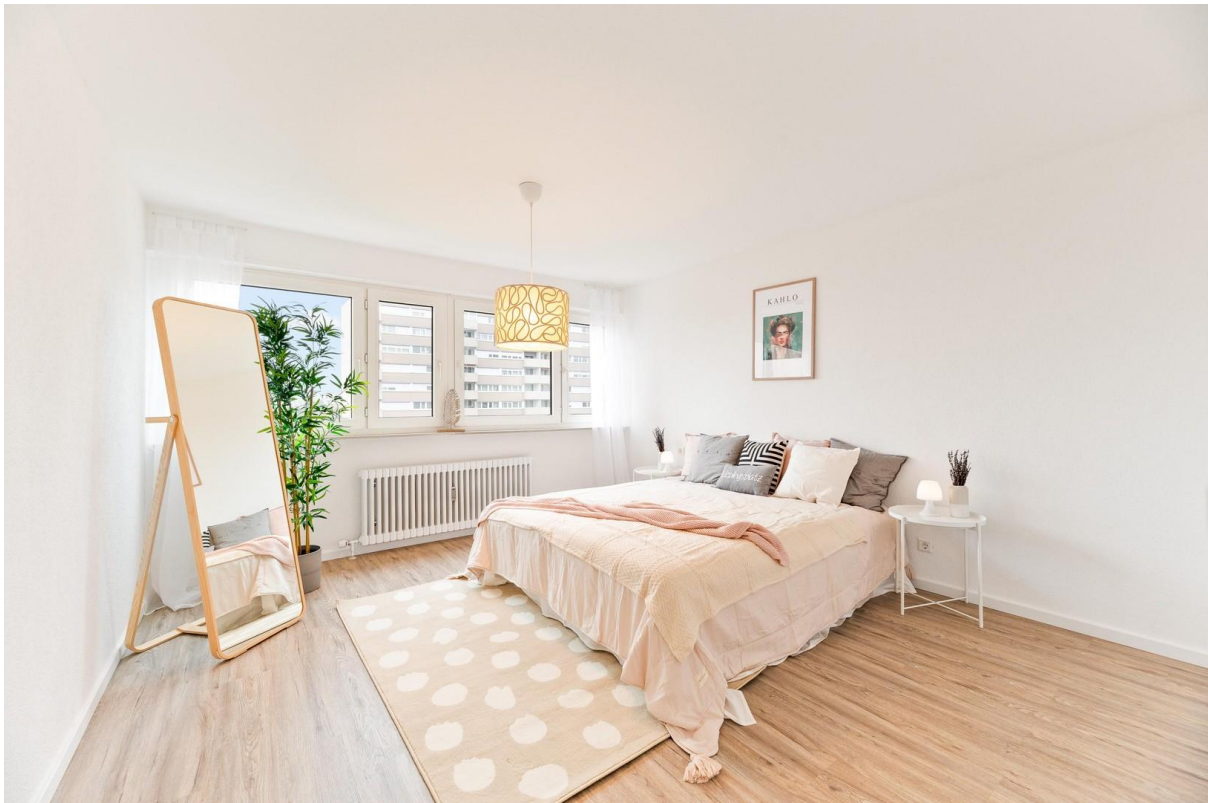
Schlafzimmer zum Träumen