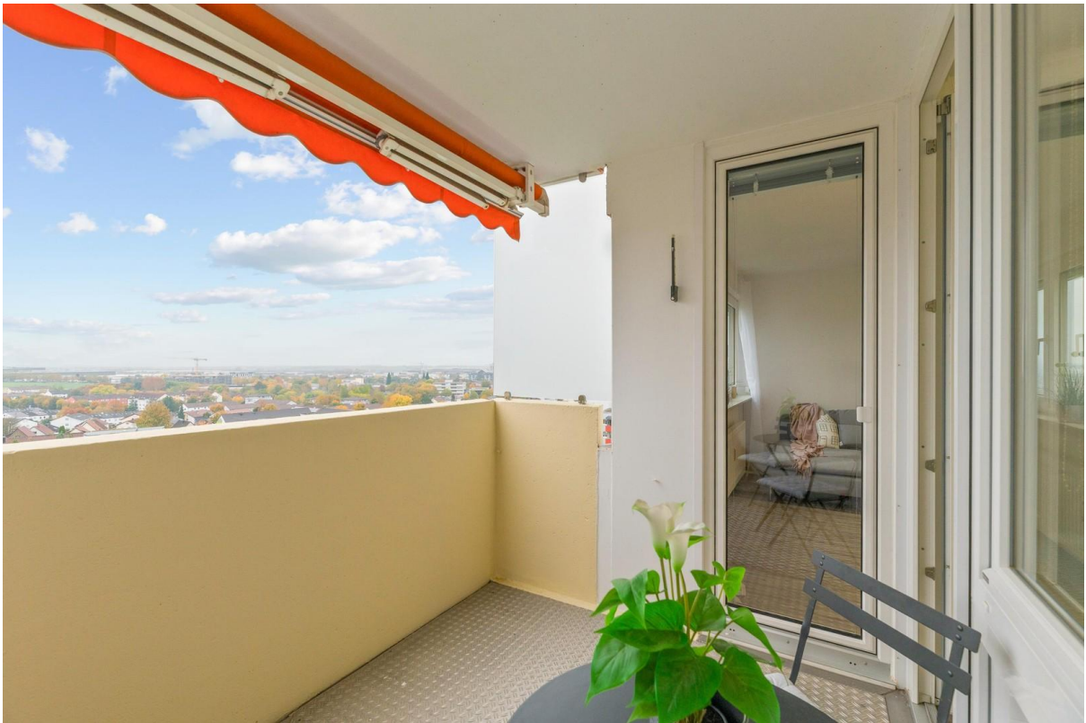
Balkon mit Traumblick